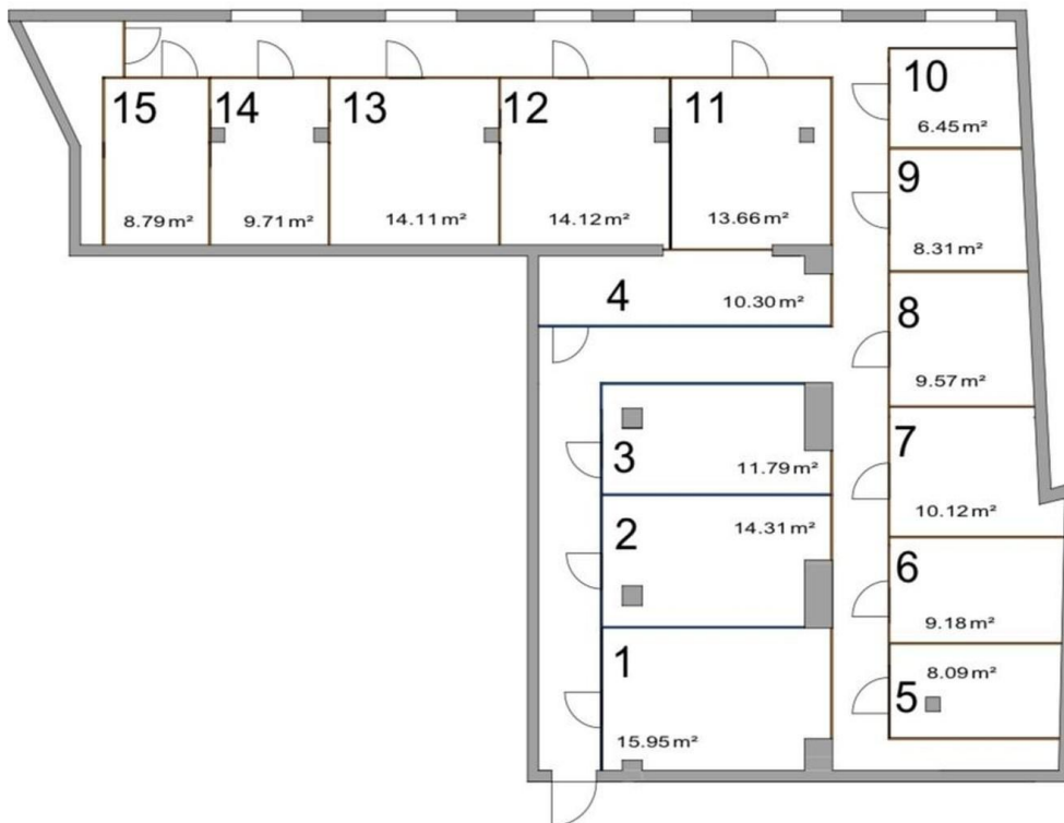
Grundriss mit Kellerabteilen

Bitte beachten Sie, dass die Maße auf dem Grundriss nur ungefähre Angaben darstellen und daher nicht verbindlich sind.