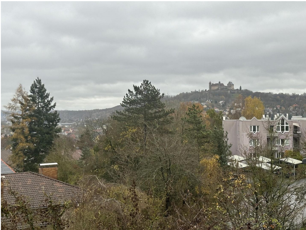
Aussicht zur Veste