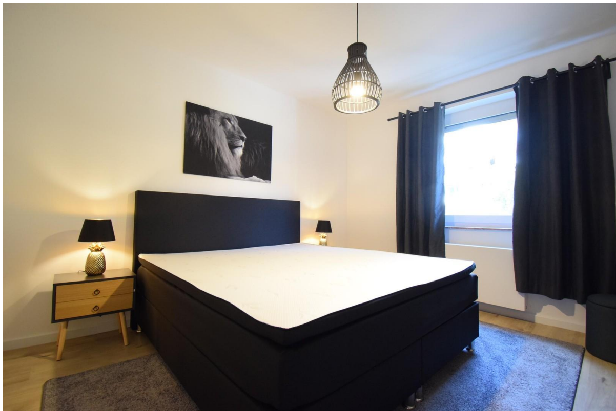
Schlafzimmer mit Boxspringbett