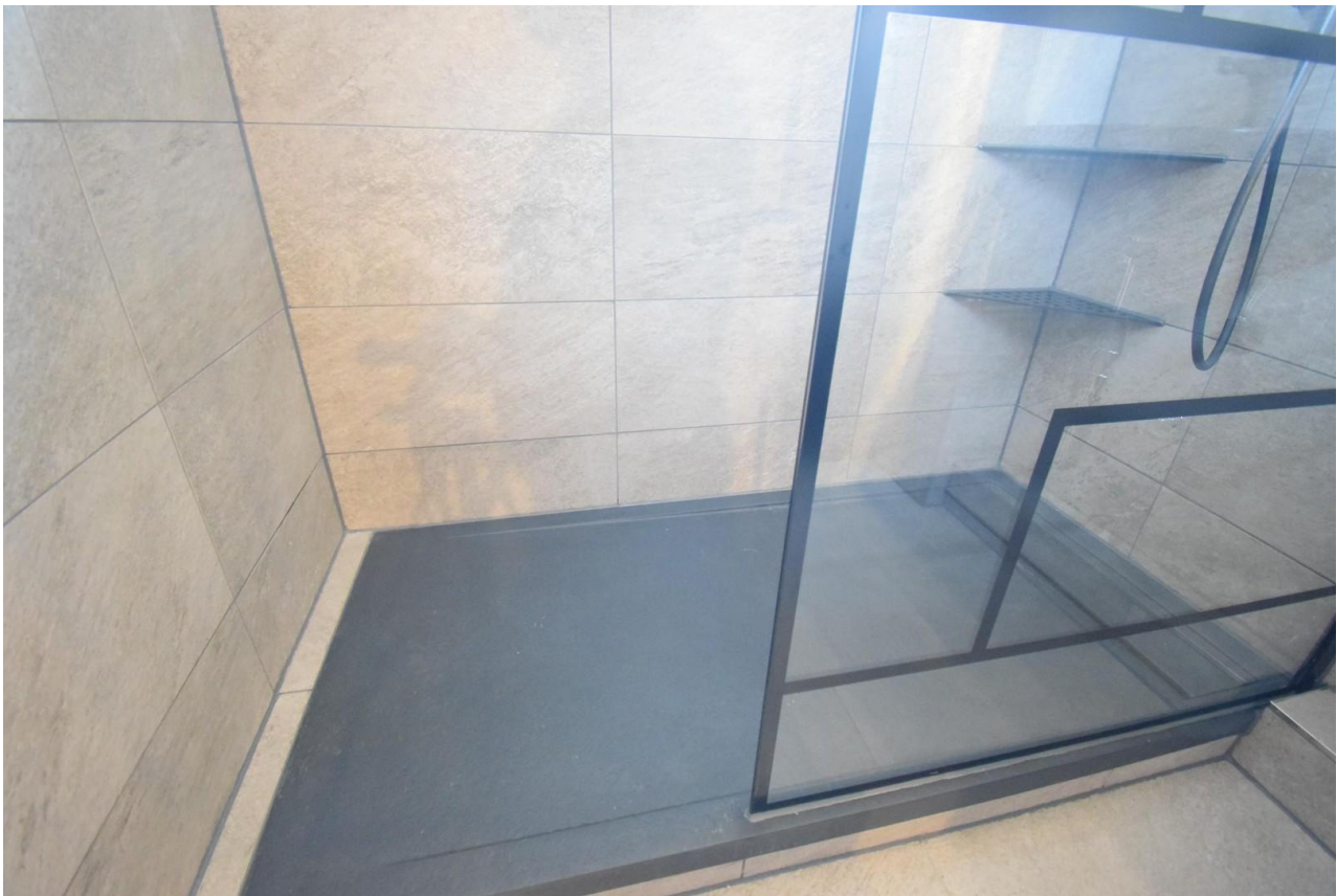
Bad mit Duschtasse