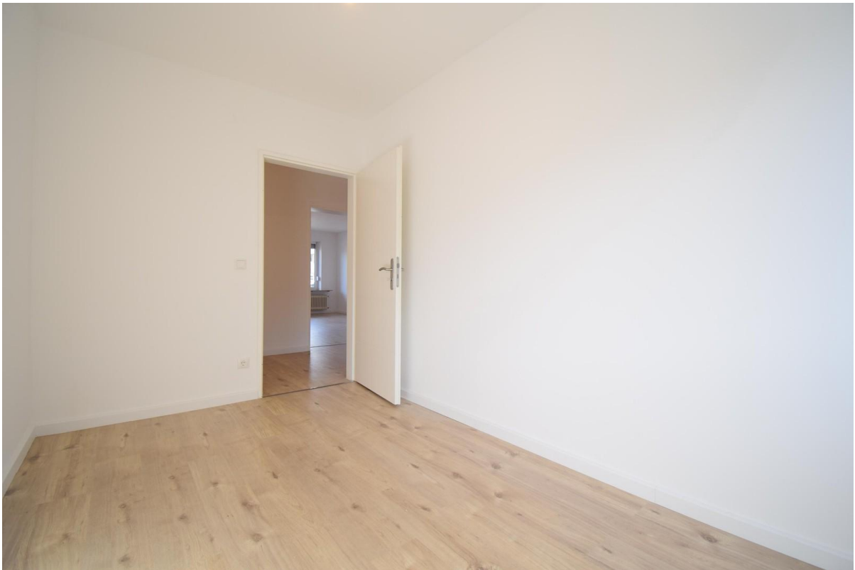
Office / Kinderzimmer