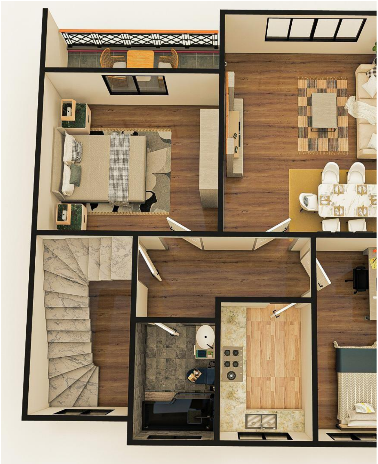
Grundriss mit Möbeln