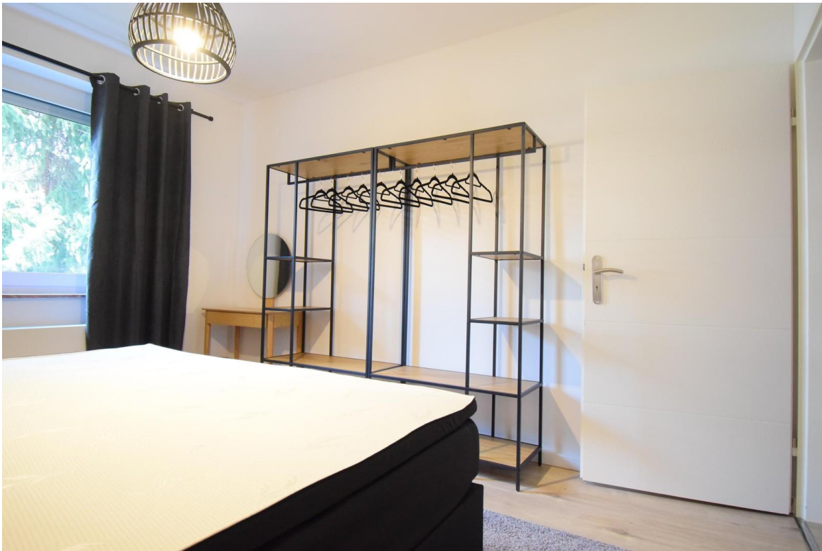
Schlafzimmer mit Boxspringbett