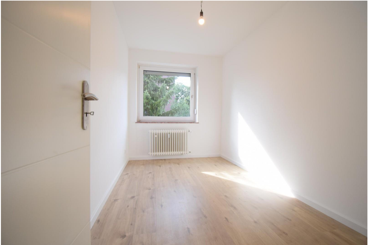
Office / Kinderzimmer