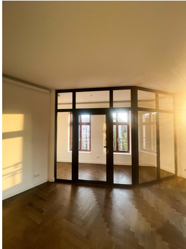
Wohnbereich mit Wintergarten