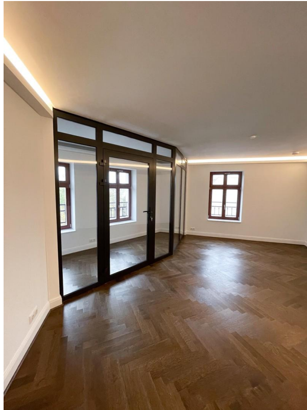
Wohnbereich mit Wintergarten