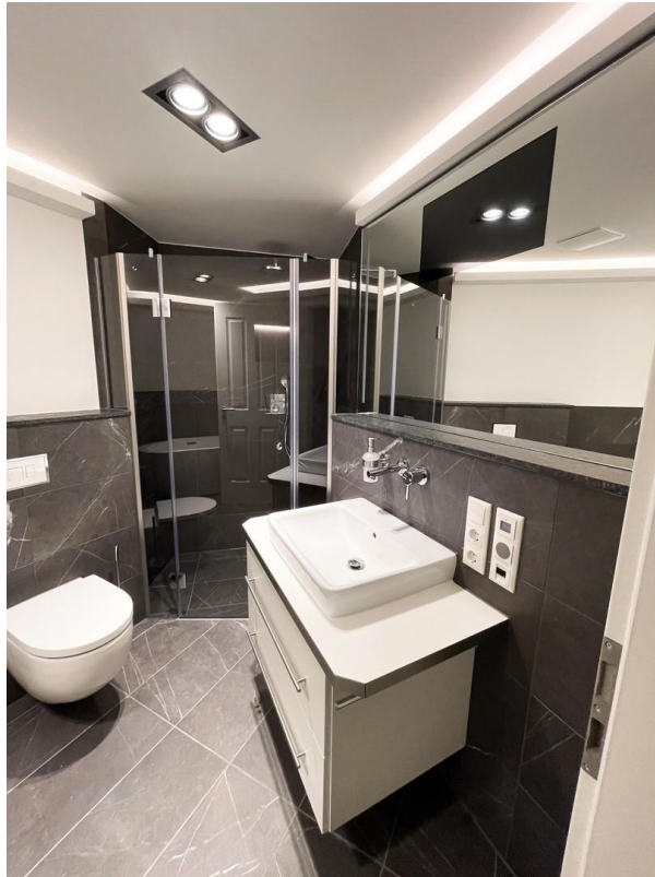
Badezimmer mit TV im Spiegel