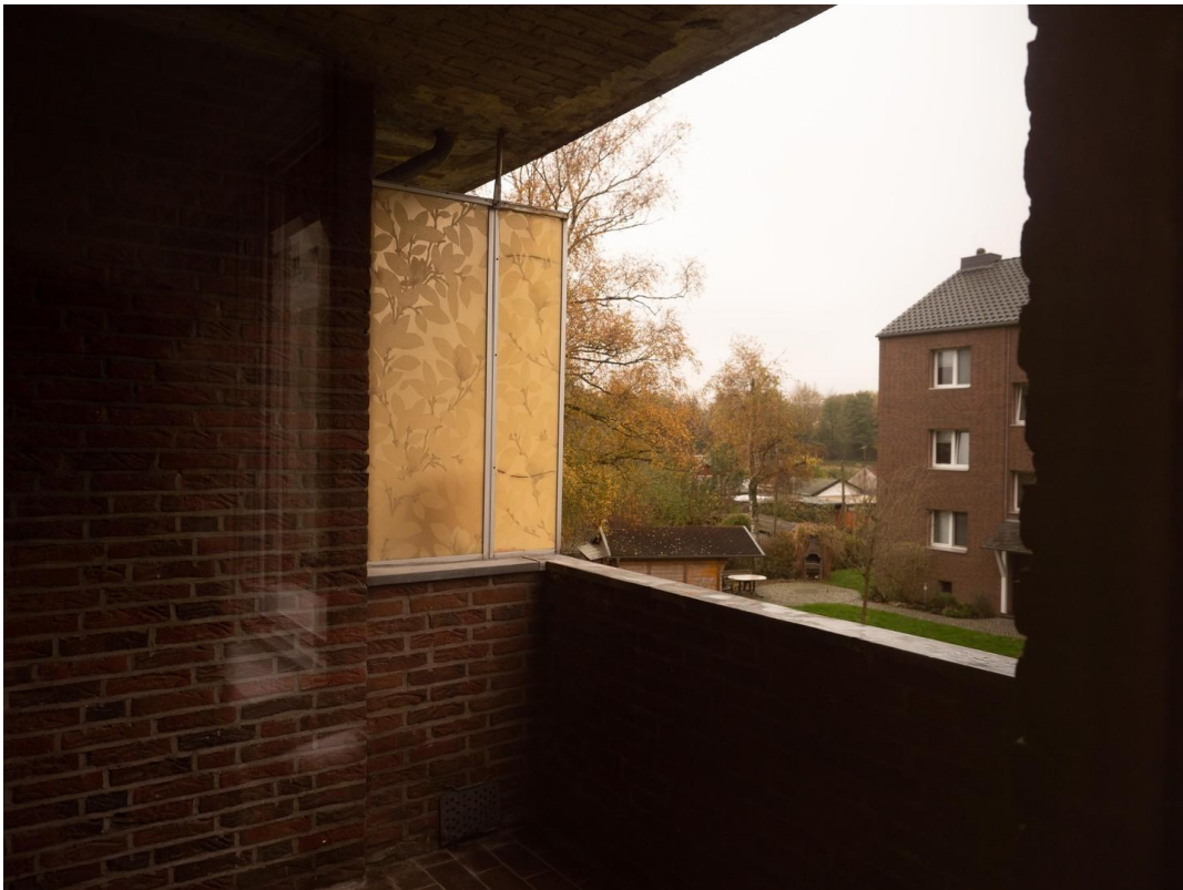
Überdachter Balkon (Loggia)