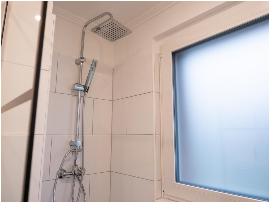
Regendusche und neues Fenster