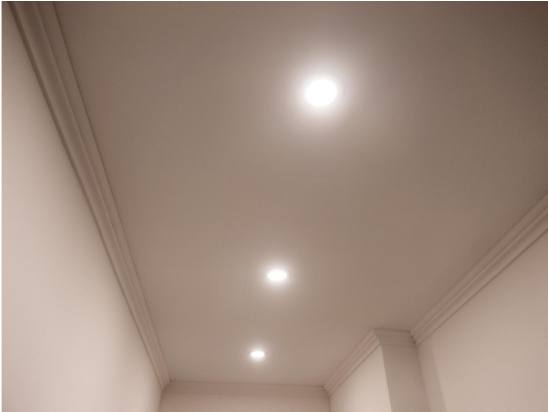
LED Spots im Badezimmer