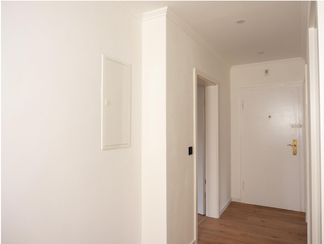
Diele mit neuem Schaltkasten