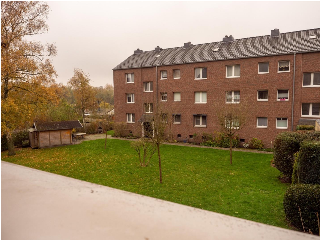
Blick ins Grüne