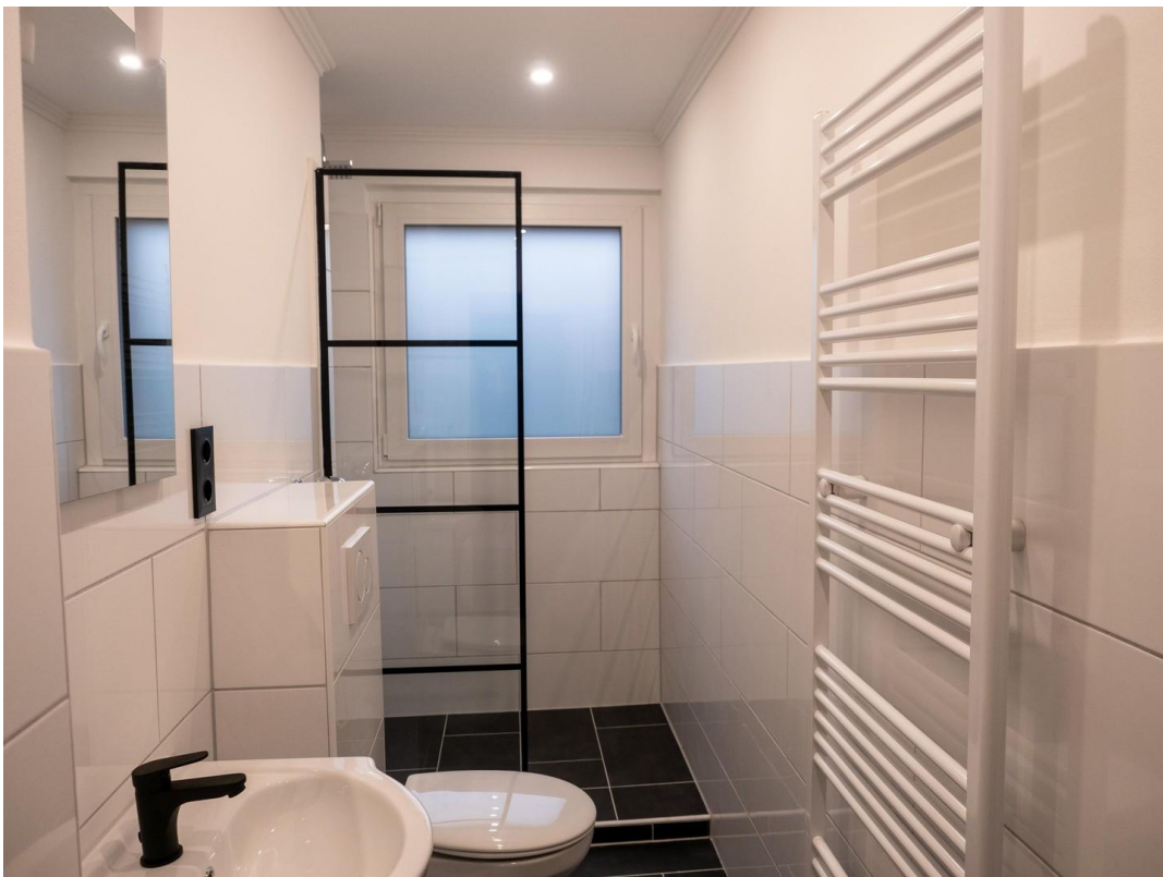
Neues Bad mit Tageslicht