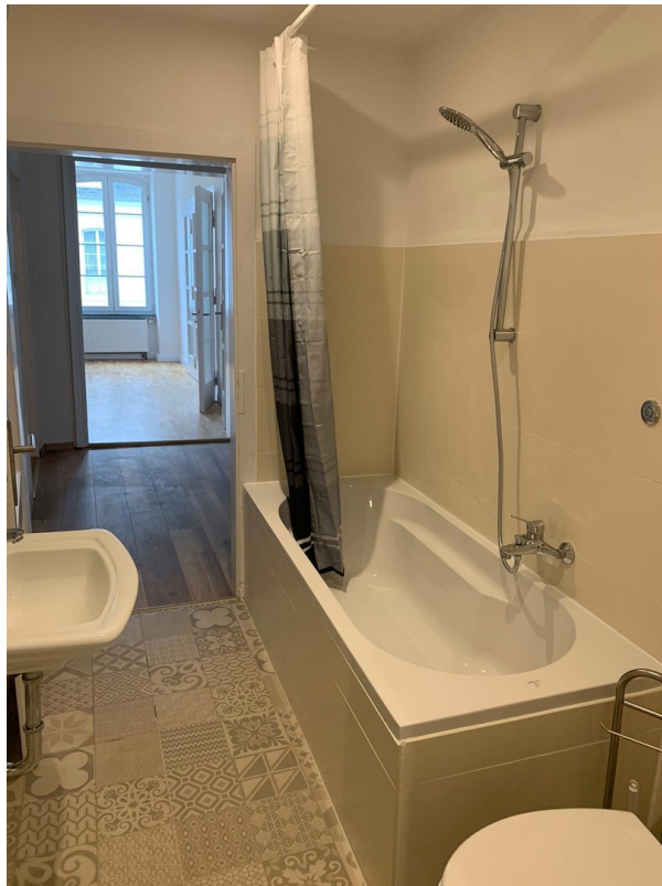
Badezimmer mit Abstellraum