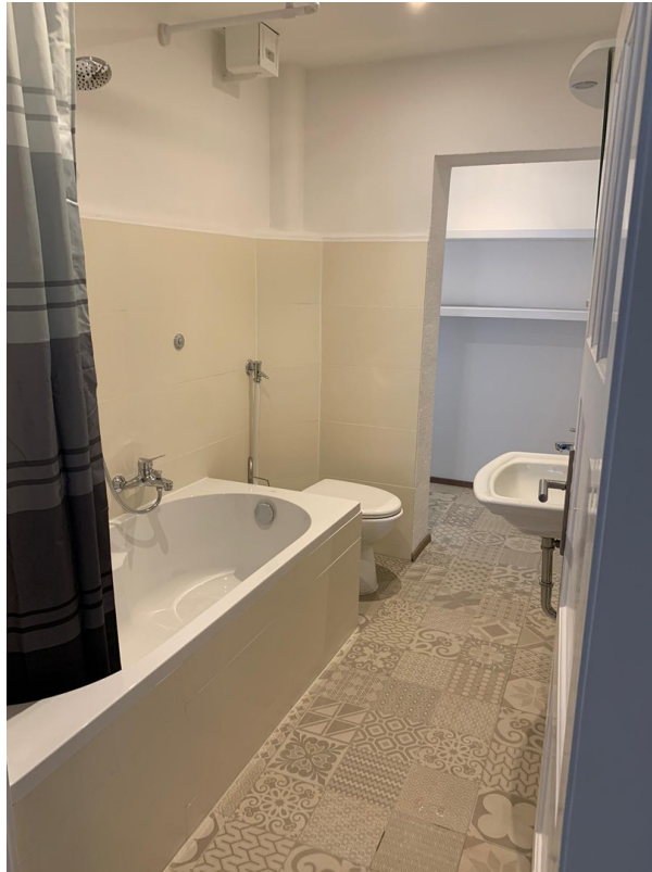
Badezimmer mit Abstellraum