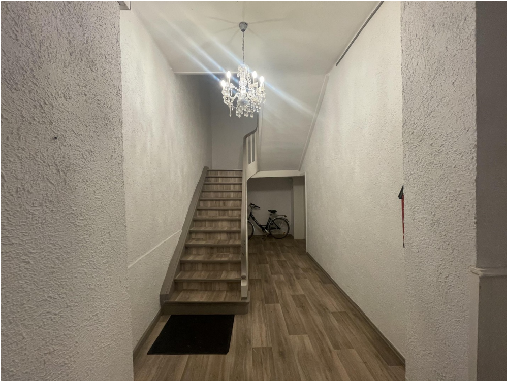
Flur zum 1. Stock