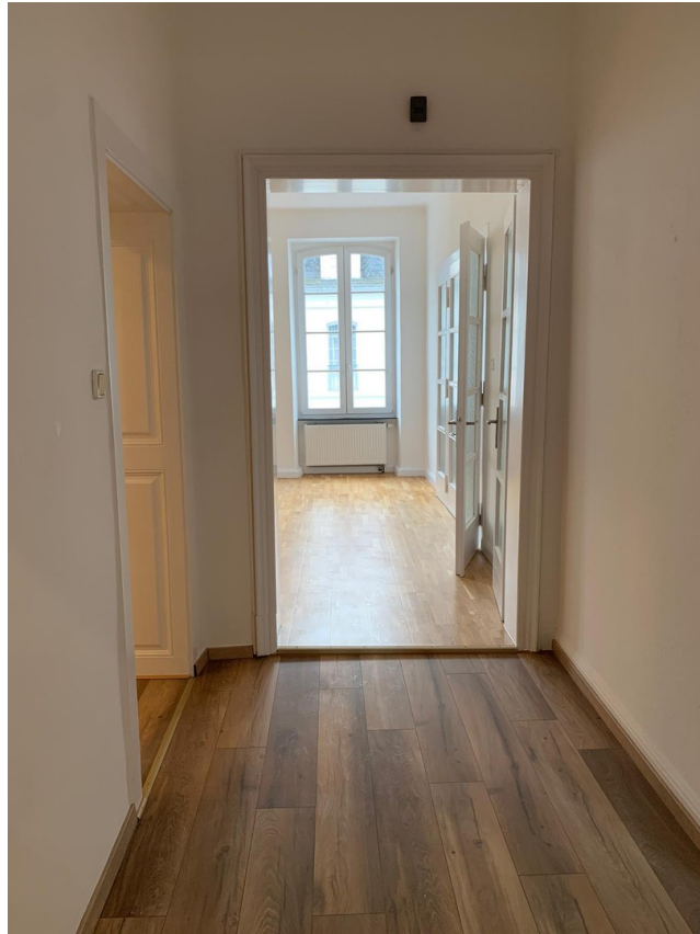
Flur zum Wohnzimmer