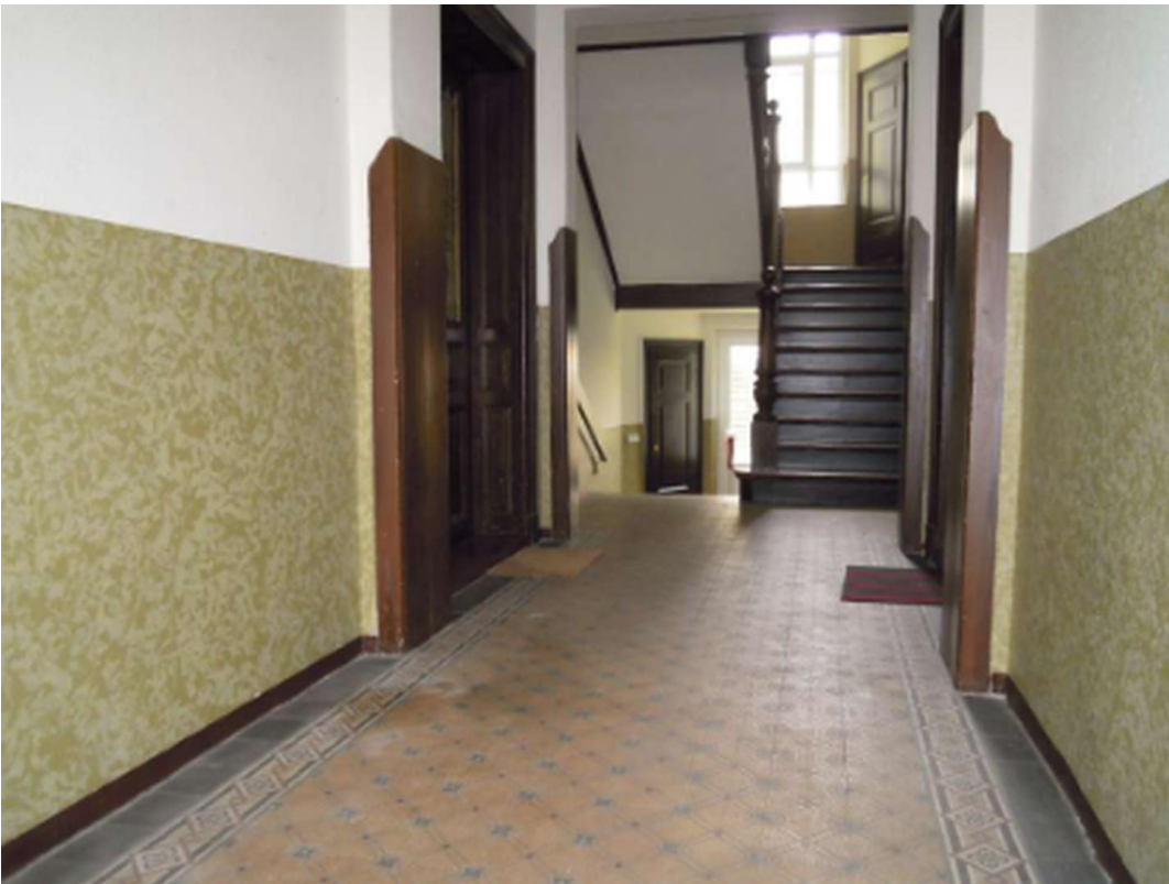
Hausflur Foto 2