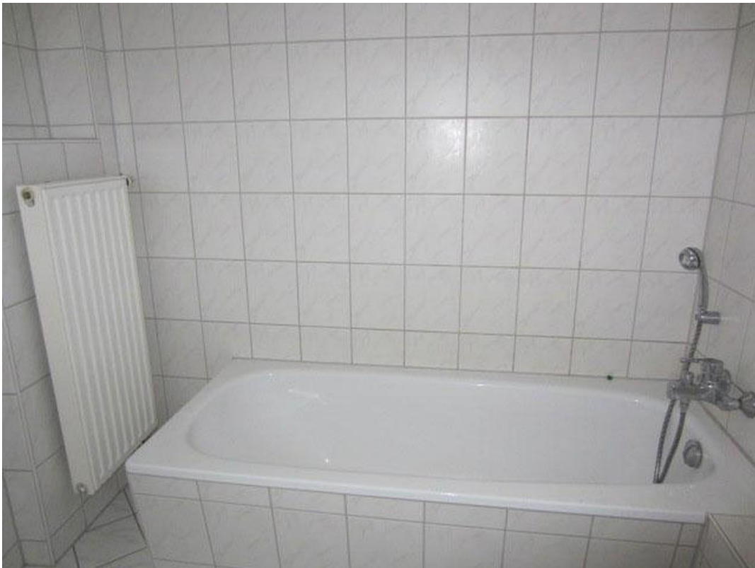
Bad mit Wanne Foto 2