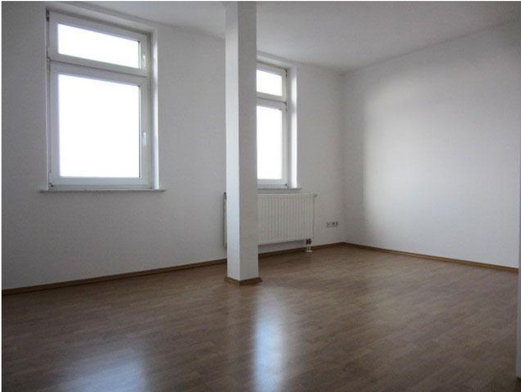
Zimmer 2 Foto 2