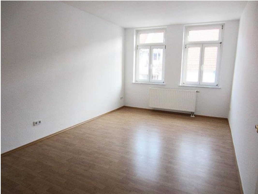
Zimmer 1 Foto 1