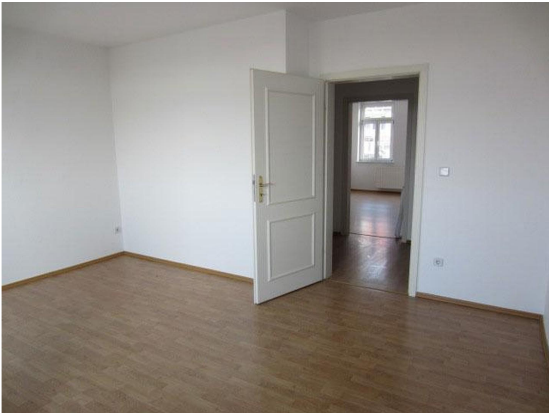
Zimmer 2 Foto 1