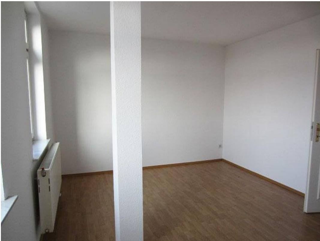
Zimmer 2 Foto 3