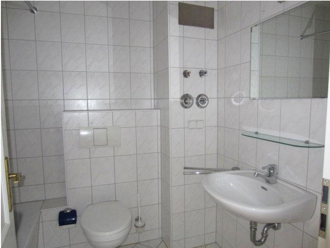
Bad mit Wanne Foto 1