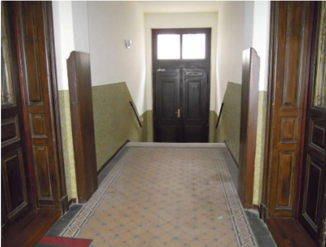
Hausflur Foto 1