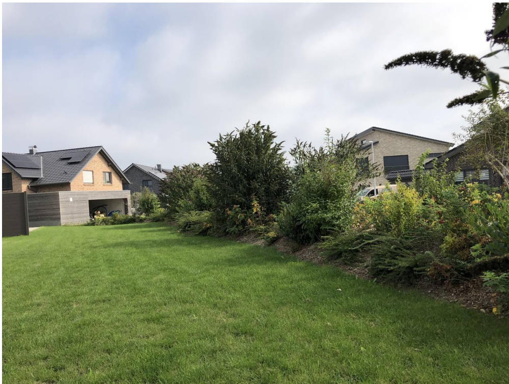
Blick ins Grüne