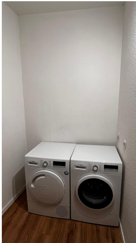
Waschmaschine und Trockner