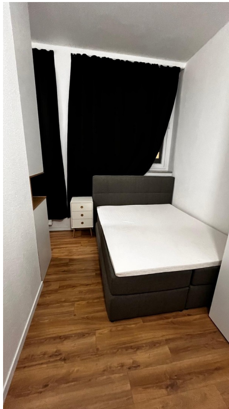
Schlafzimmer mit Doppelbett