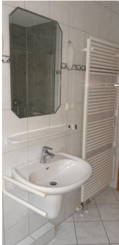
Bad Waschbecken mit Heizkörper