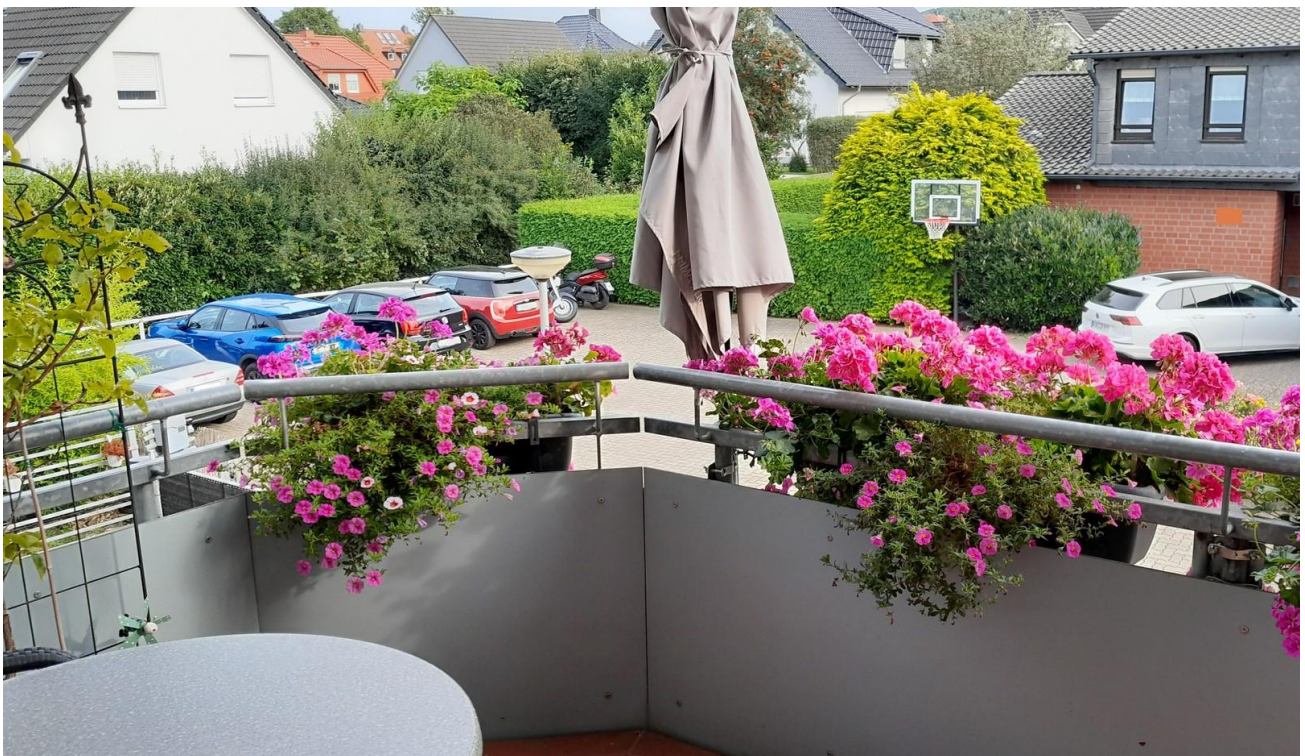
Balkon - Aussicht