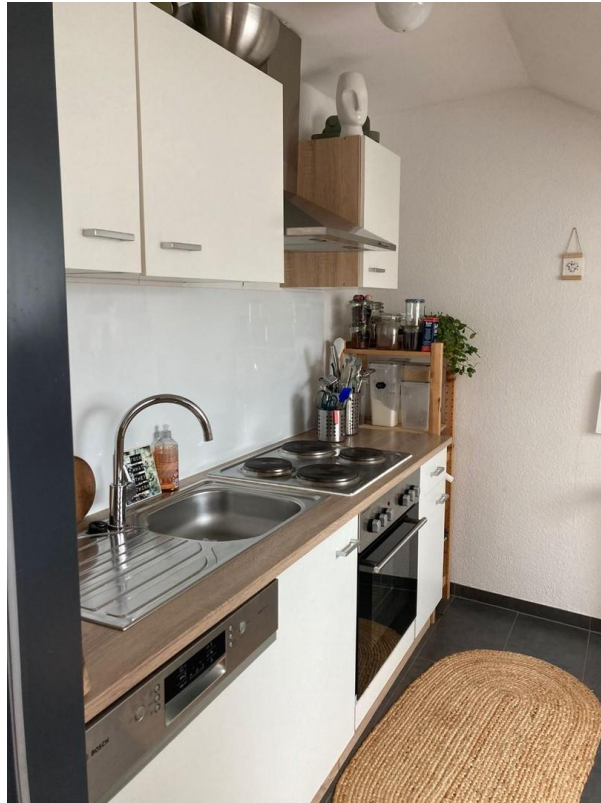
Einbauküche mit Geräten