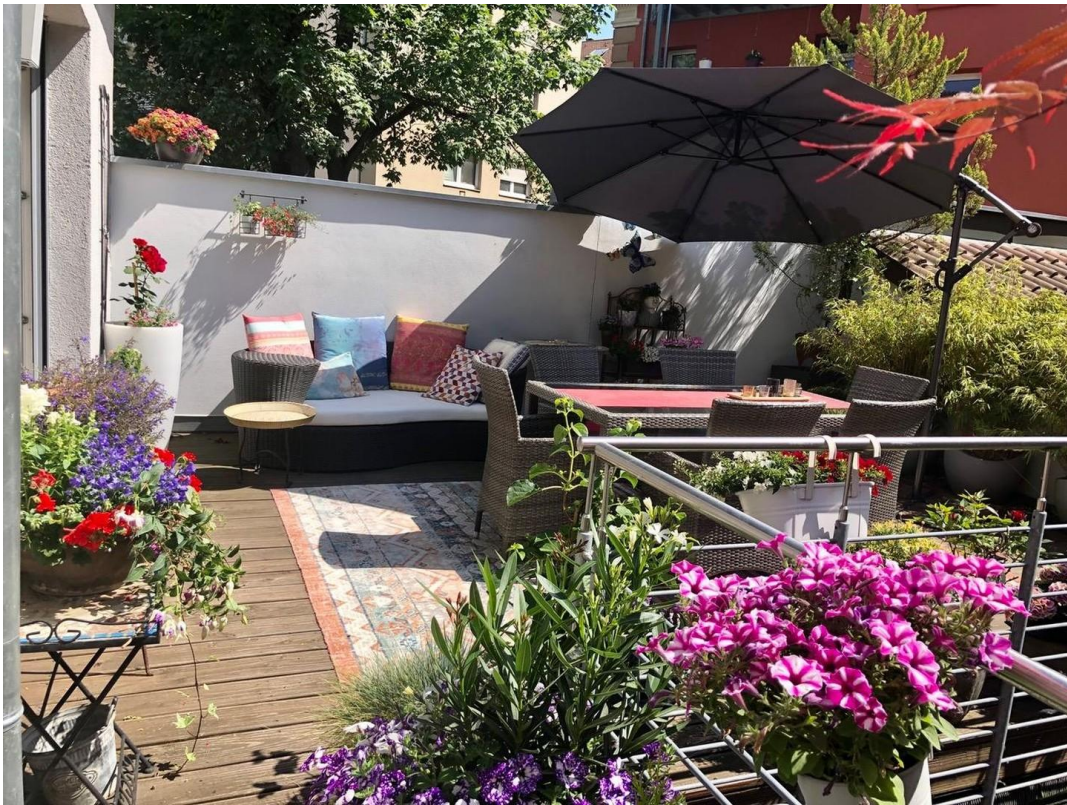
Terrasse im Sommer