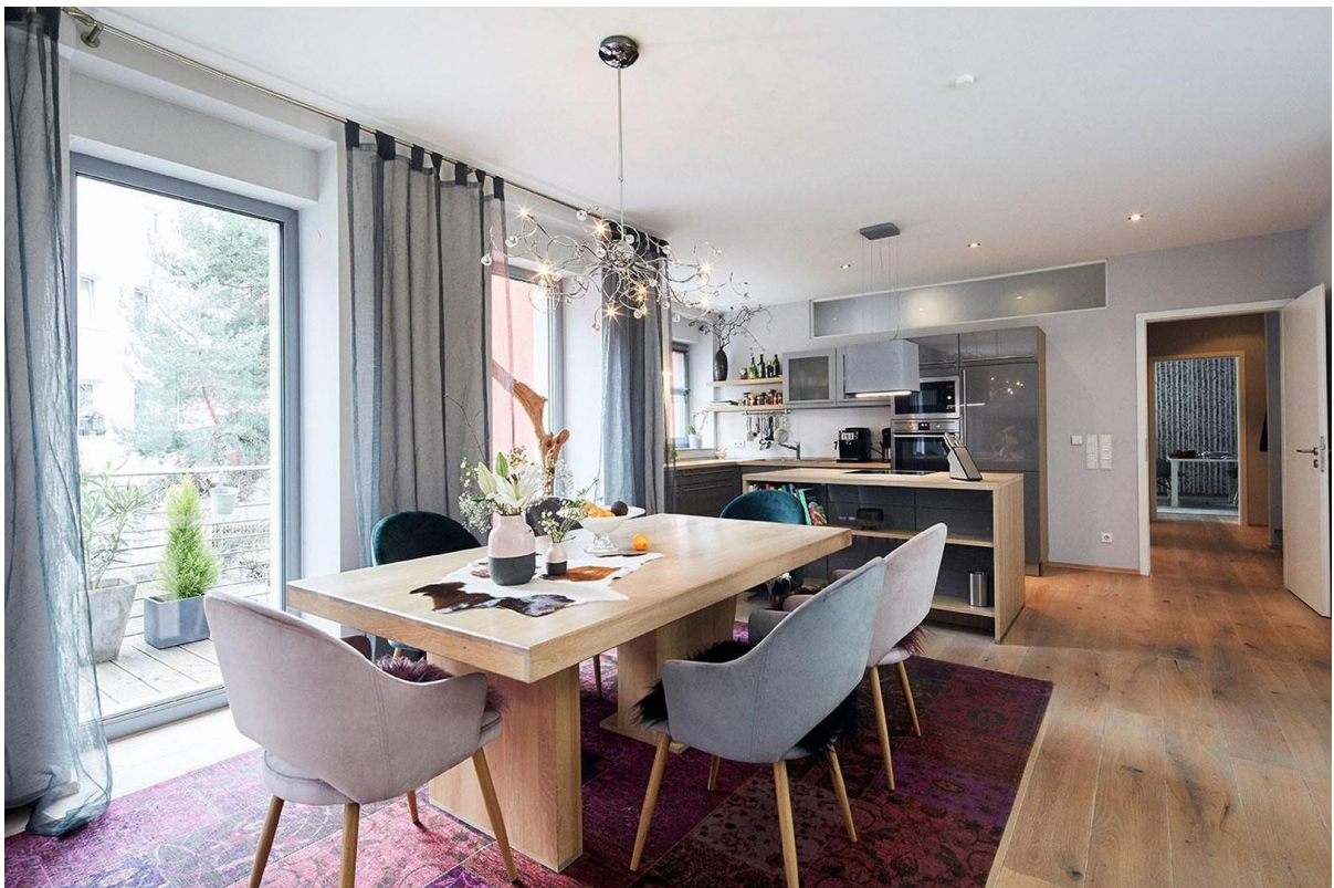
Wohnzimmer mit Küche