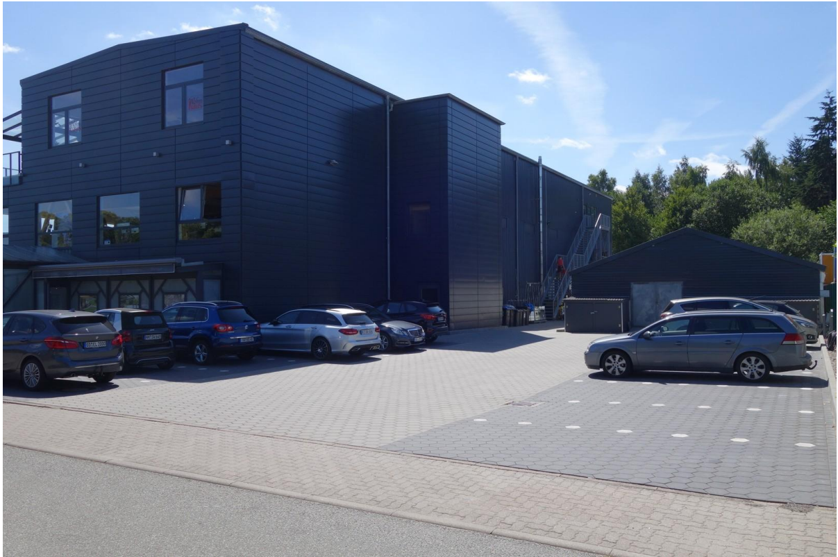
Rückseite und Parkplatz