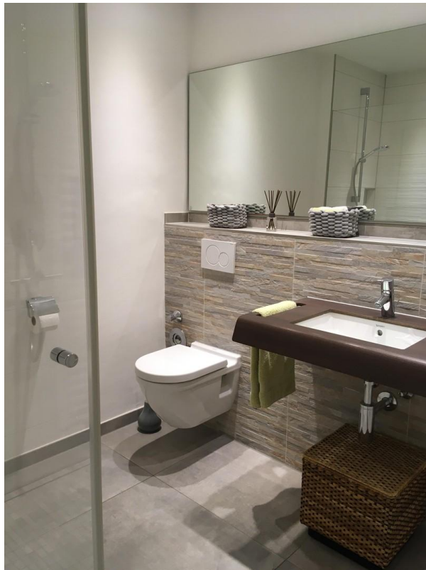
Gäste-WC mit Dusche