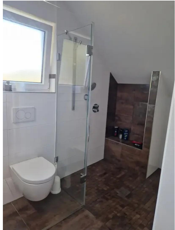
Dusche OG, barrierefrei