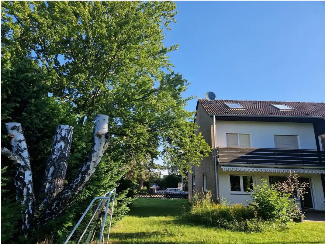
Garten, Blick Gebäudeseite