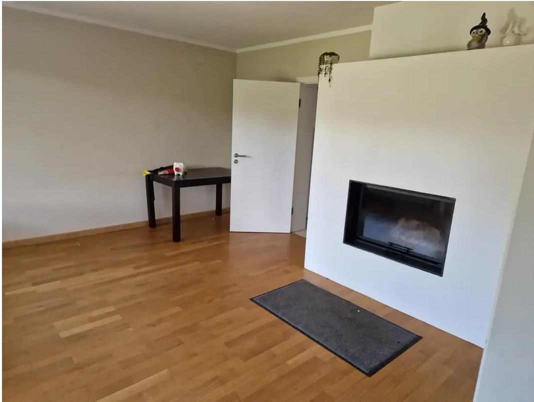
Kaminofen im Wohnzimmer