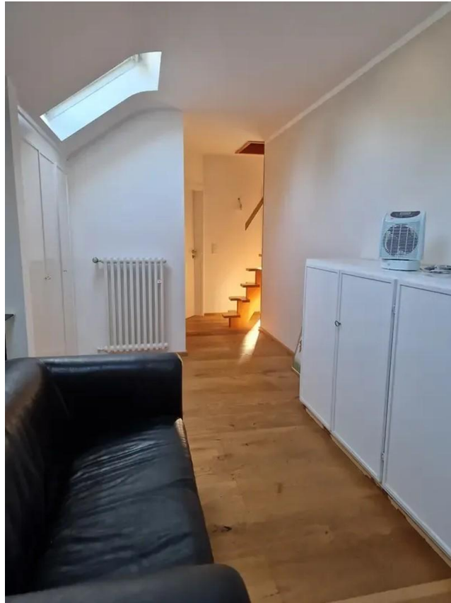
Aufgang zum DG