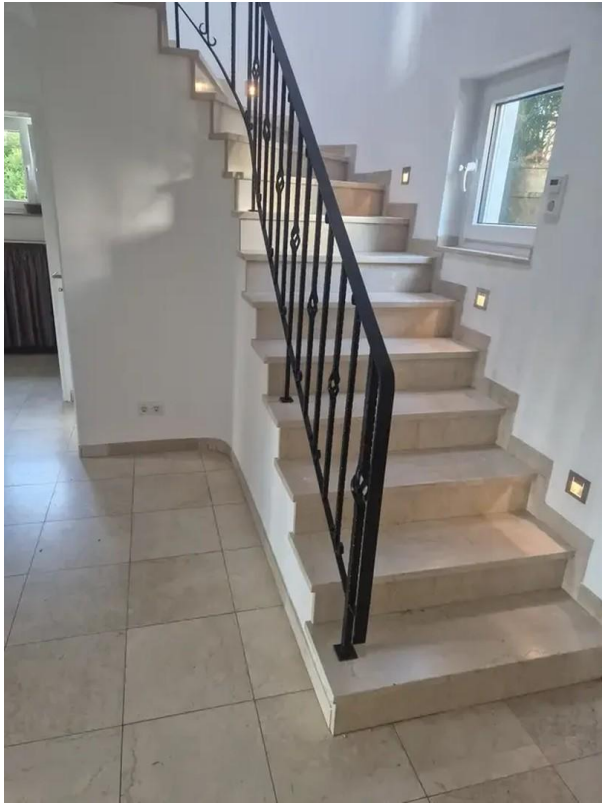
Aufgang zum OG, beleuchtet