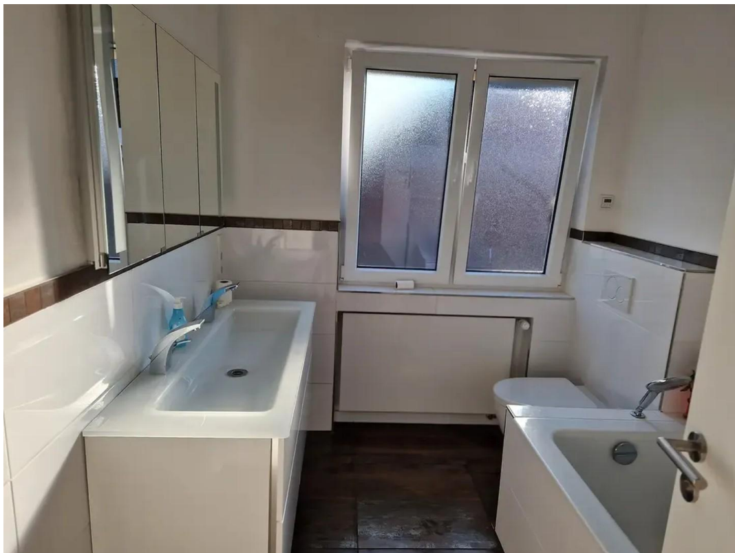
Bad im OG