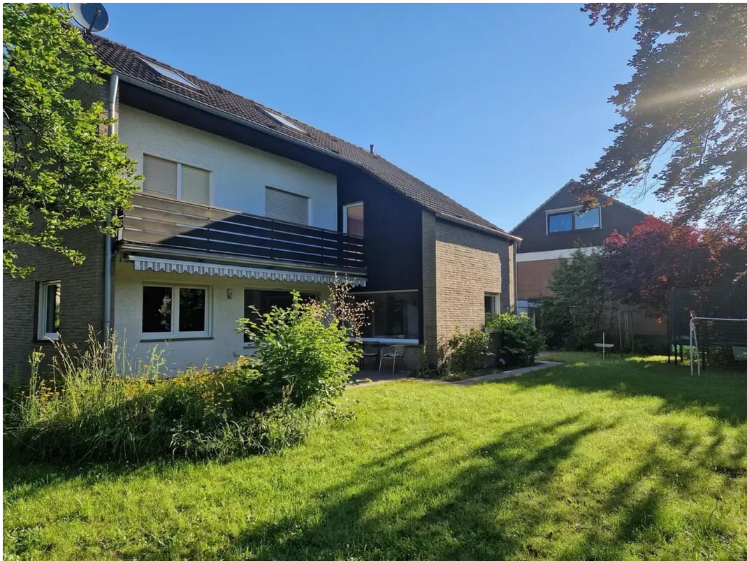
Garten, Blick auf Rückseite