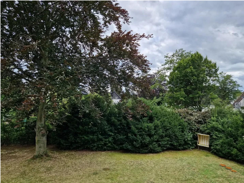
Garten mit alter Blutbuche