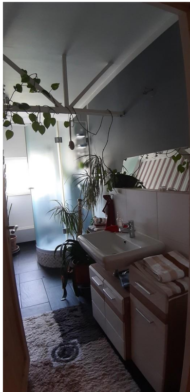
Betriebswohnung Bad 2