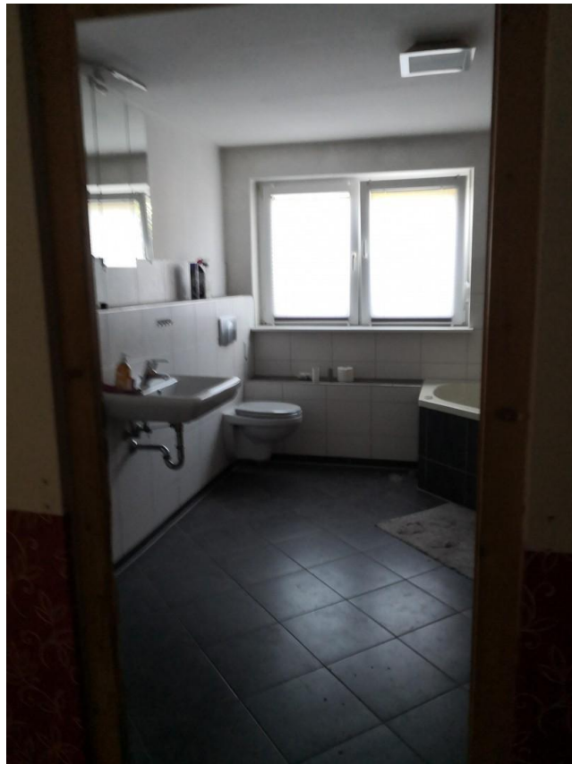
Betriebswohnung Bad 1