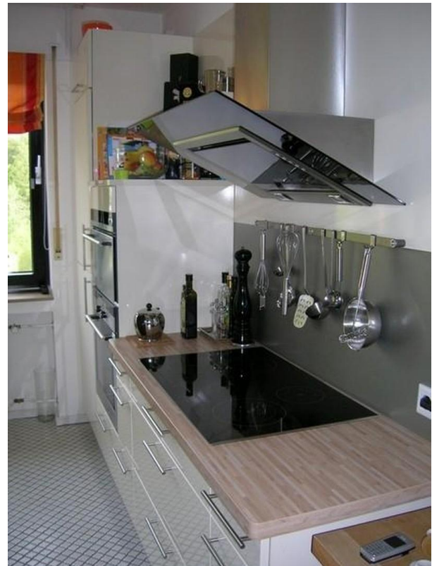
Küche m. Einrichtung