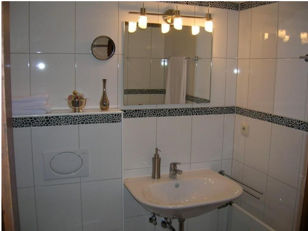
2. Bad mit Dusche