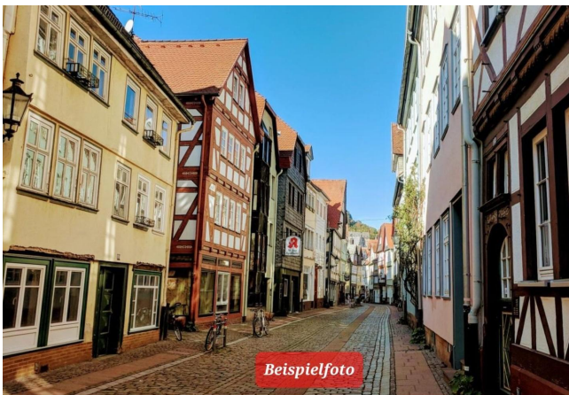
Die Weidenhäuser Straße