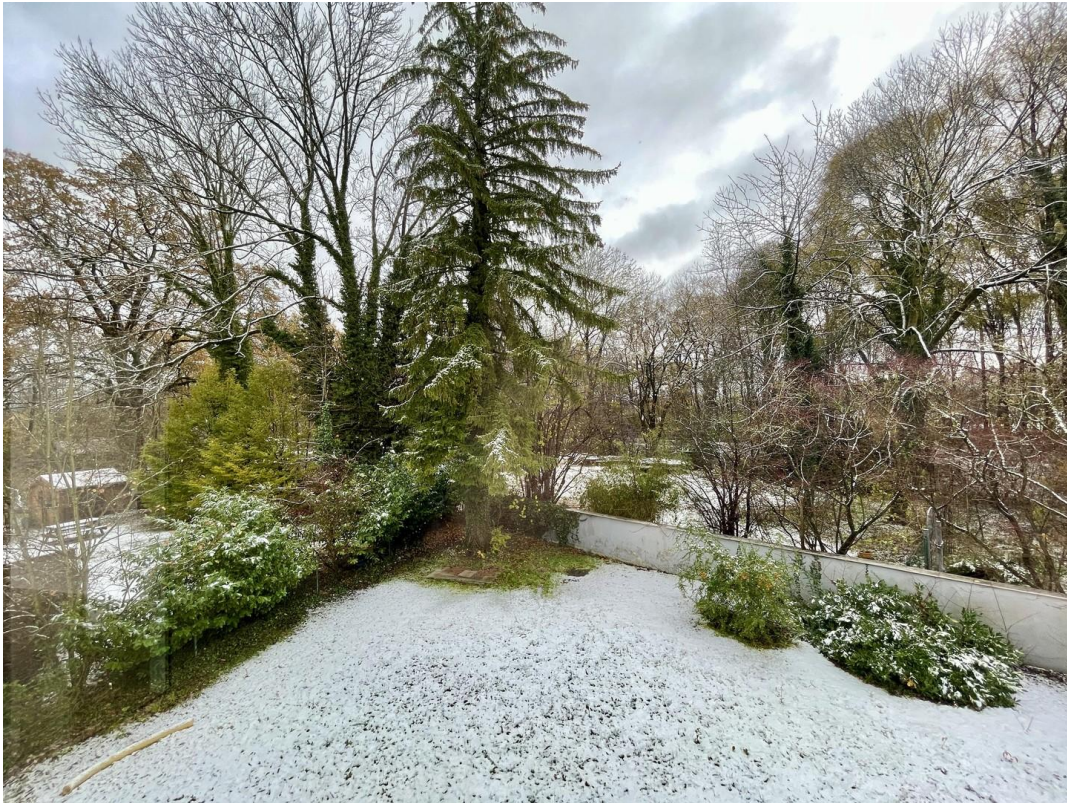
Haus direkt am Ostpark