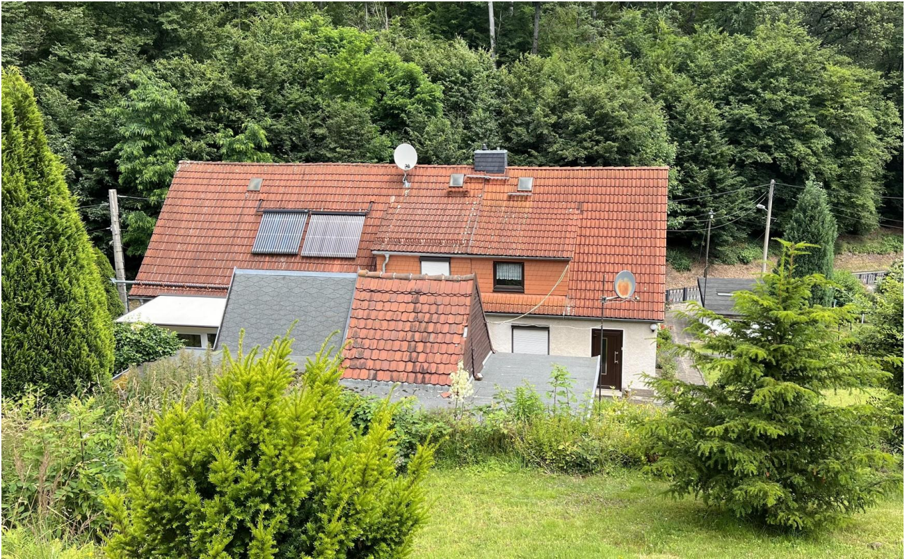
Blick auf das Haus