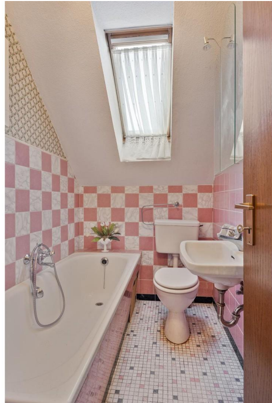
Badezimmer Apartment OG