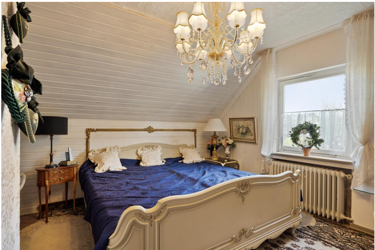
Schlafzimmer Apartment OG