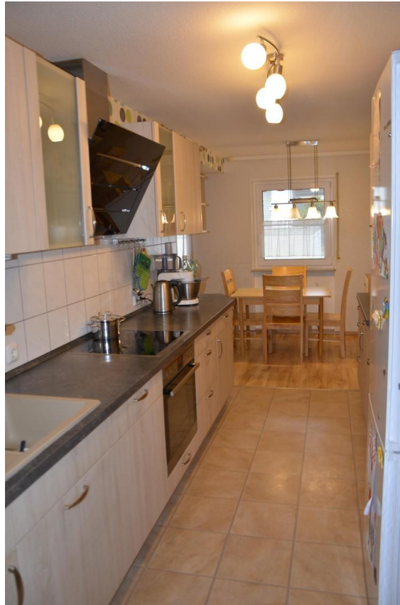
Küche + Essecke