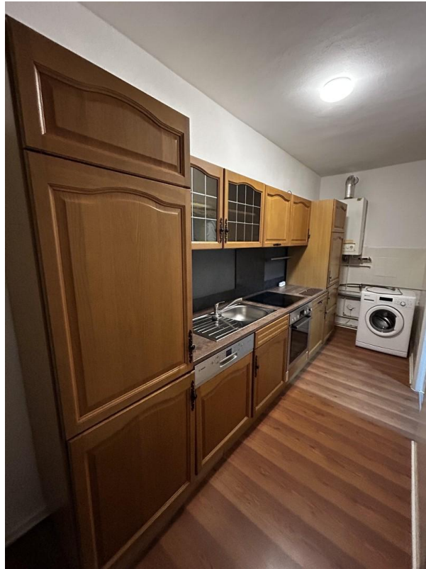
Küche 2 + Waschmaschine