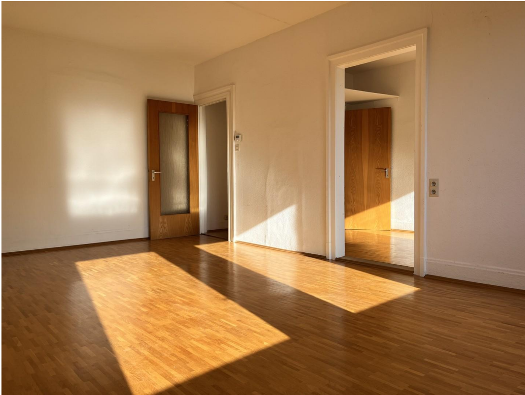
Zimmer 1 Türen