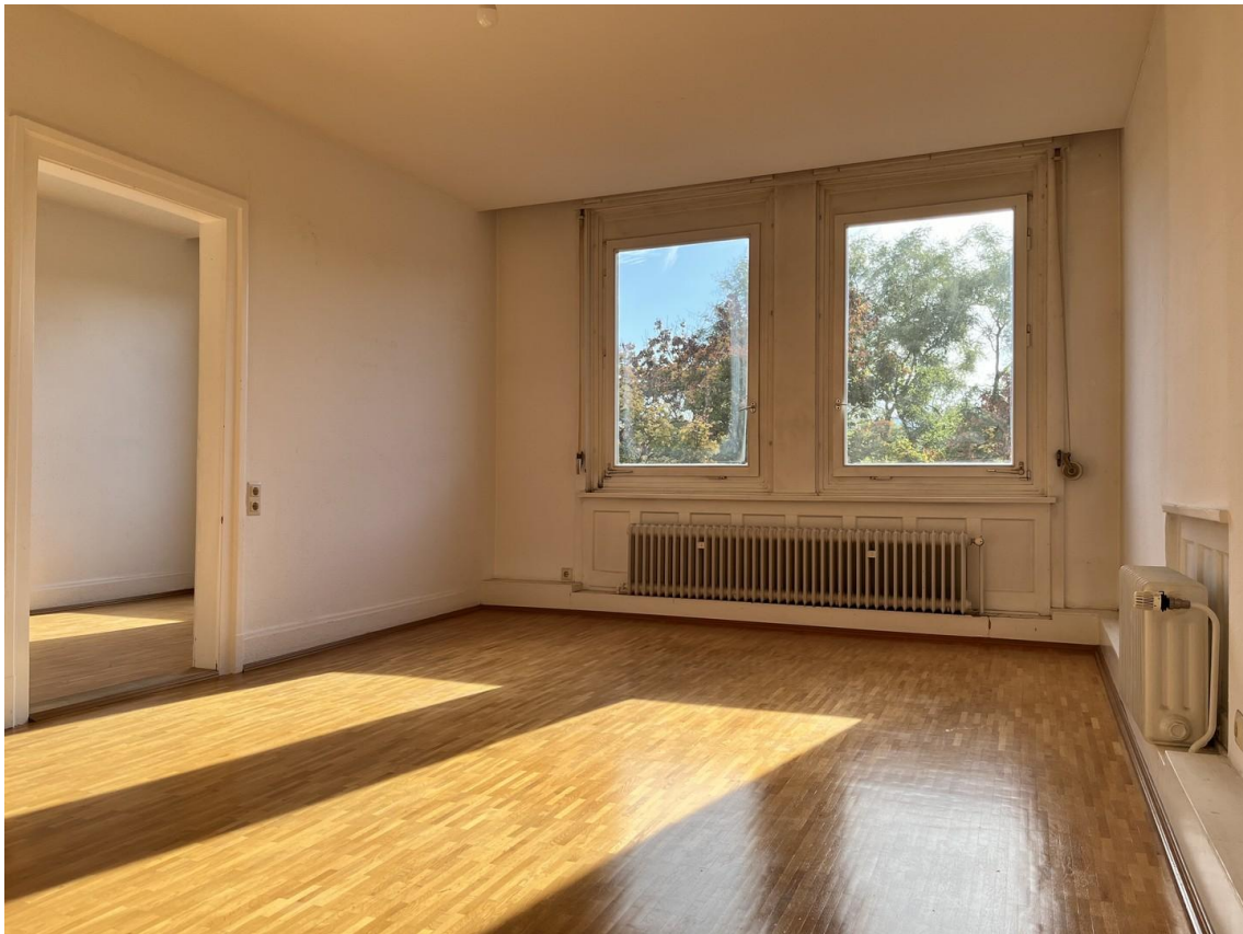
Zimmer 1 Fenster