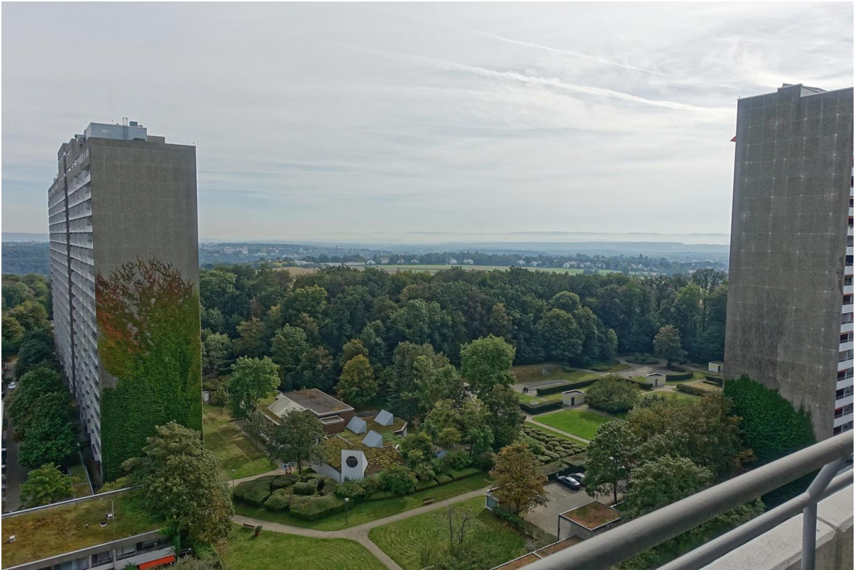
Blick nach Osten