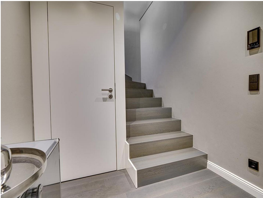
Entree / Innentreppe