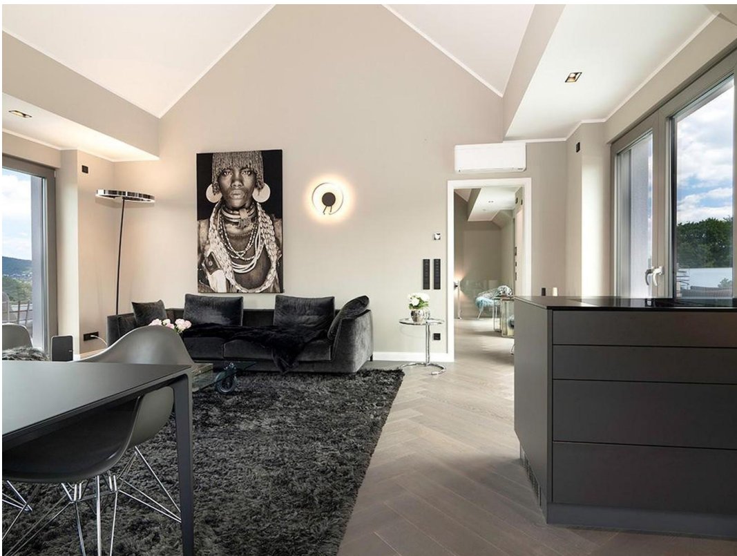
Wohnen / Essen