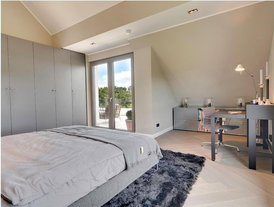
Schlafzimmer / Office