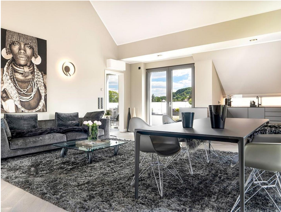
Wohnen / Essen