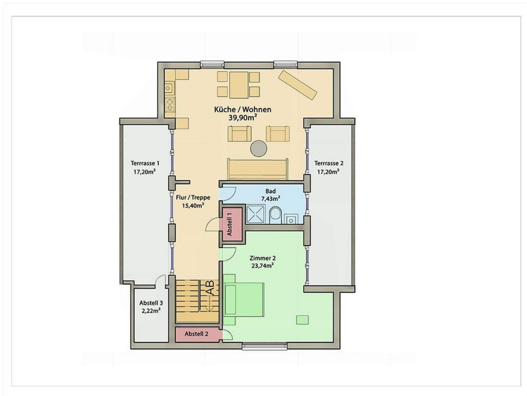
Grundriss 4. OG