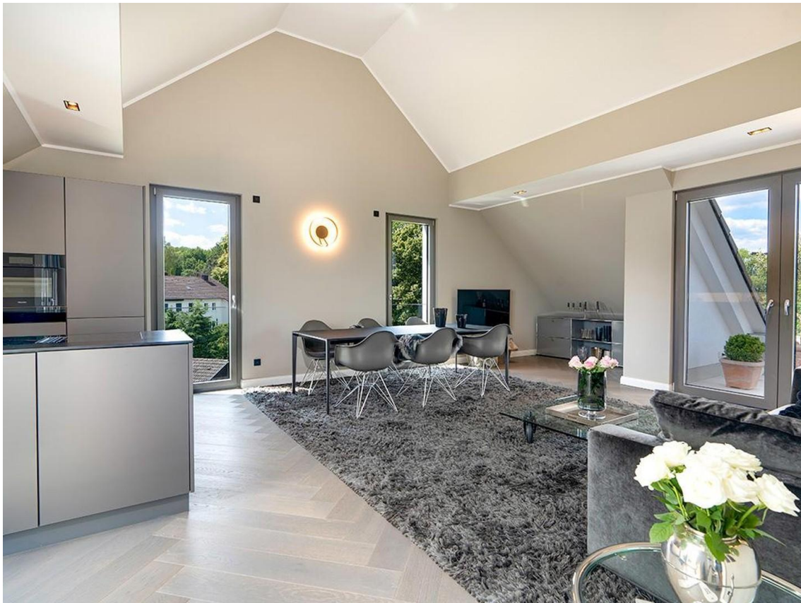
Wohnen / Essen