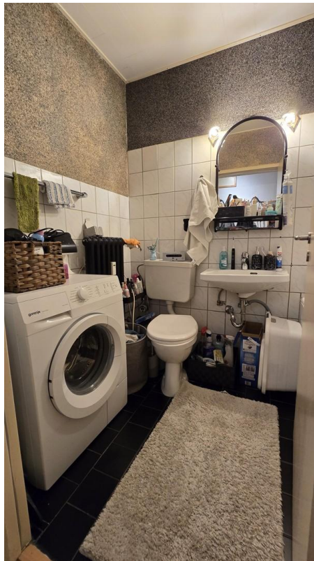
Bad mit Waschmaschine