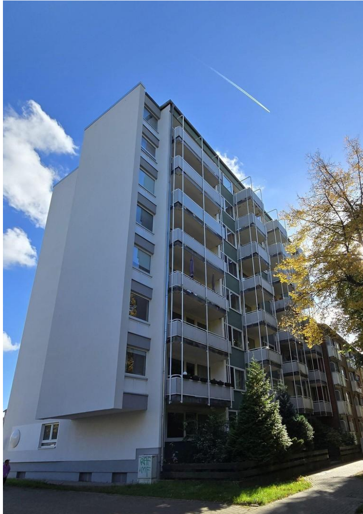
Seitenansicht des Hauses