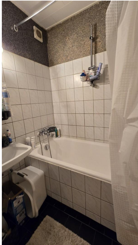
Wanne mit Dusche