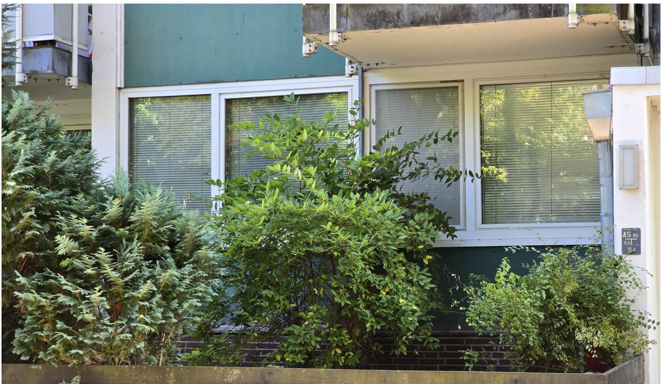
Die vier Fenster des Wohnraums