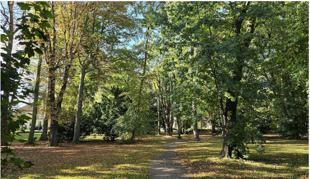
Gegenüber liegt der Park