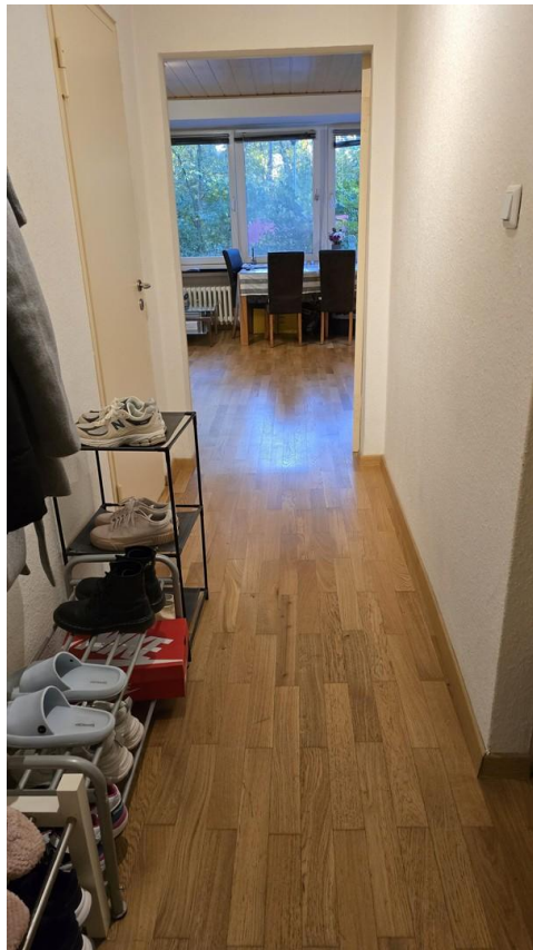
Flur zum Wohnraum