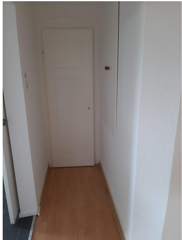
Zugang zum Gäste-WC