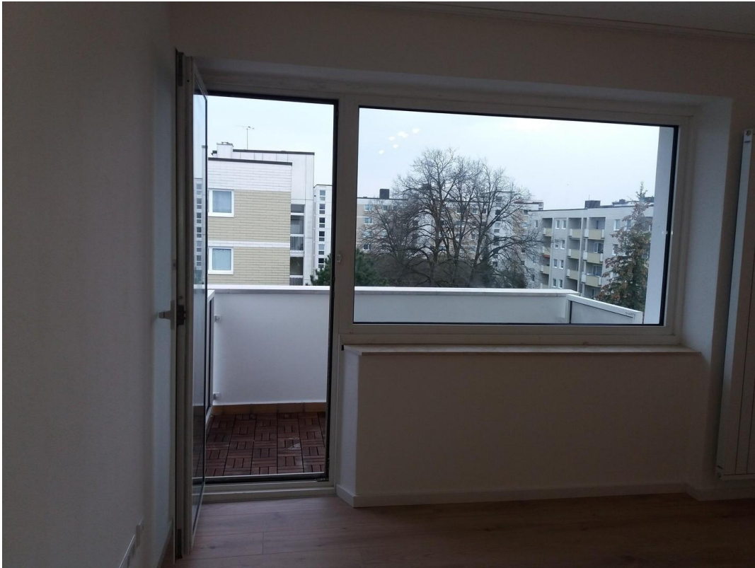
sonniger S/W Einzelbalkon