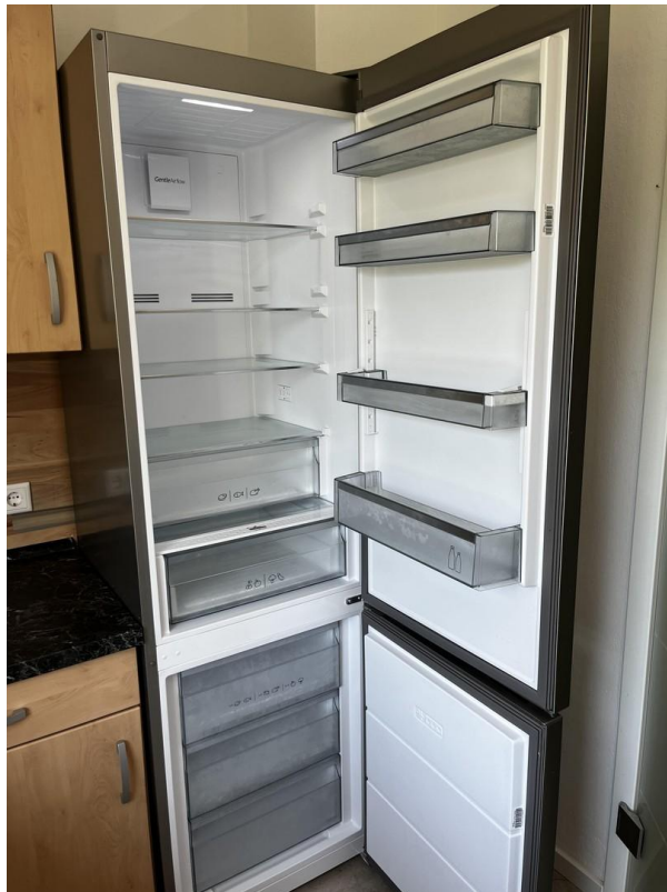
großer Kühl-, Gefrierschrank