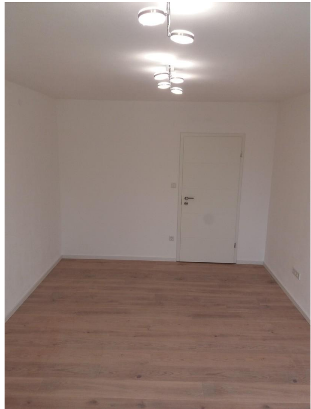
sehr großes Zimmer/Kinderz.usw