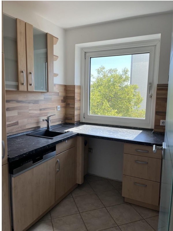
Küche freier Blick auf Bäume