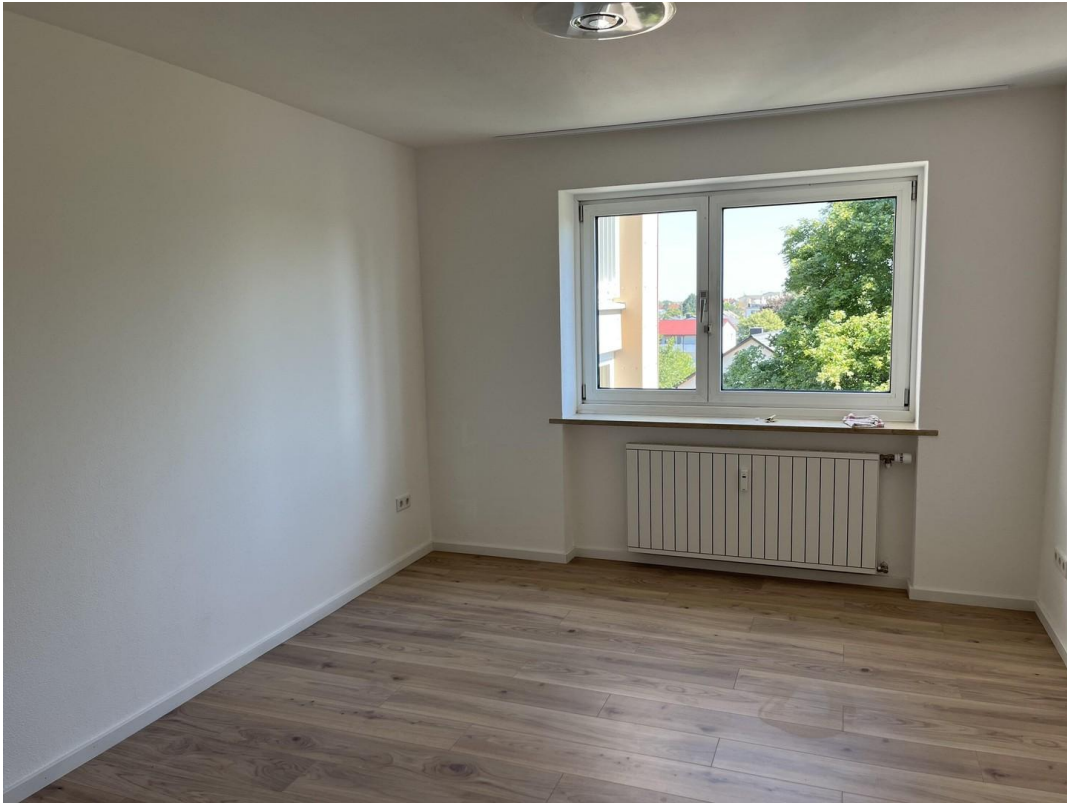
Schlafzimmer weiter Blick+Bäum