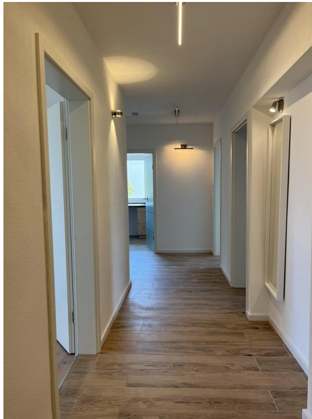
Flur LED Decke-, Wand-, Spiegel