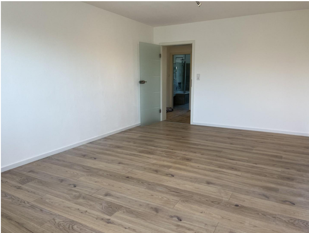
schönes helles WZ, Glastüre