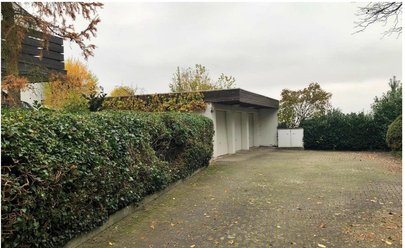
Garagen und Einfahrt