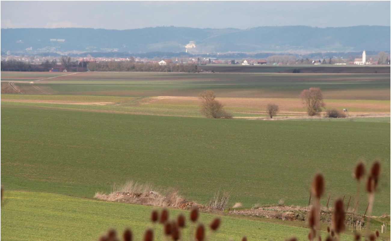
Ausblick zur Walhalla