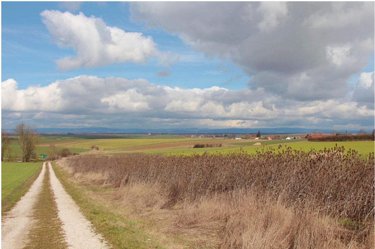
Blick in den Bayerischen Wald