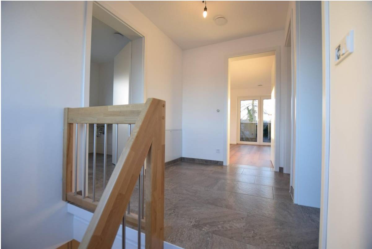
Flur im OG