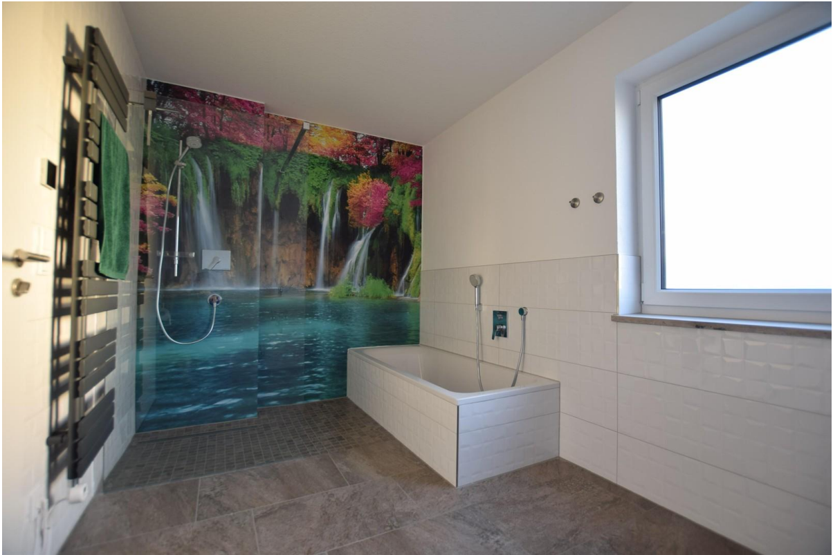
Vollbad im OG