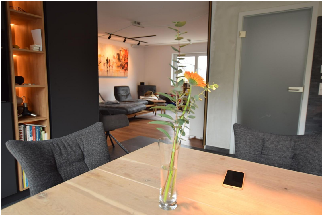
offenes Wohnen und Kochen