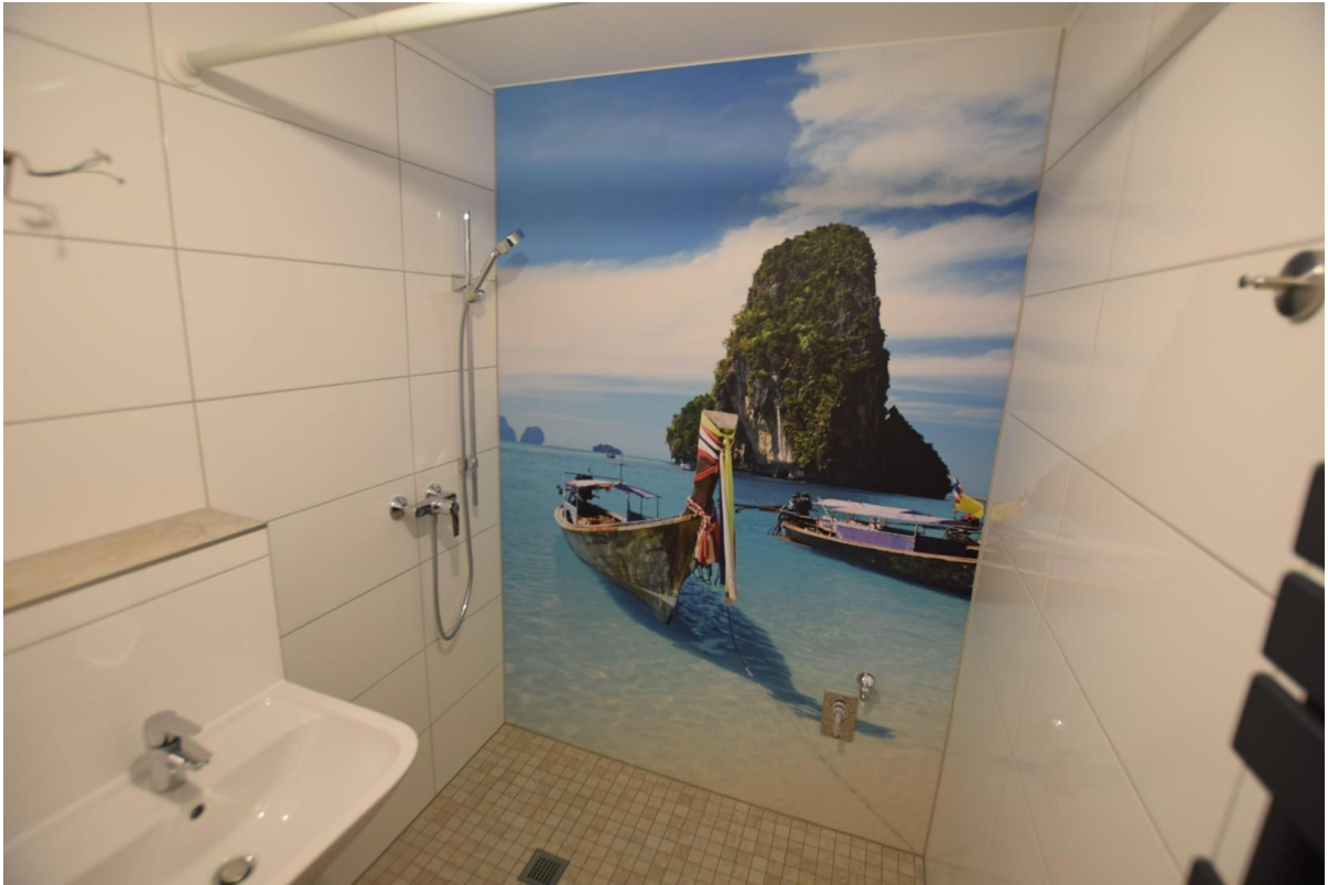
Duschbad im Souterrain