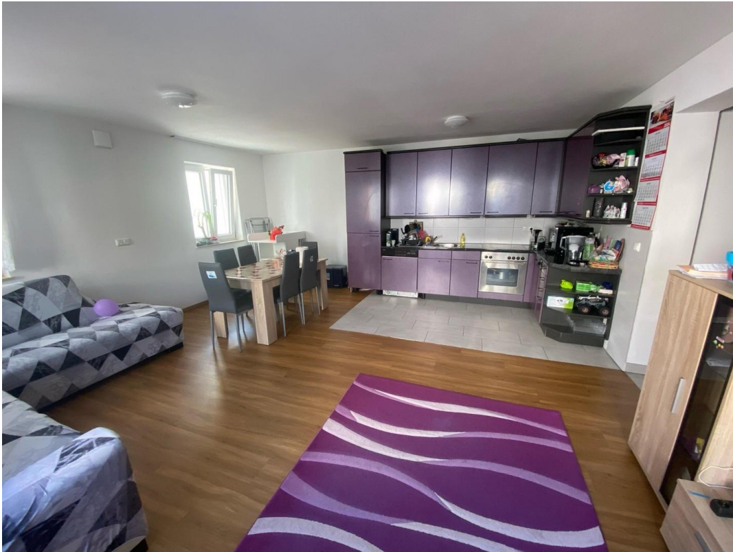
Wohnzimmer mit Küchenzeile