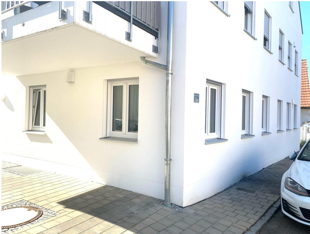
Wohnung Süd-West Ansicht