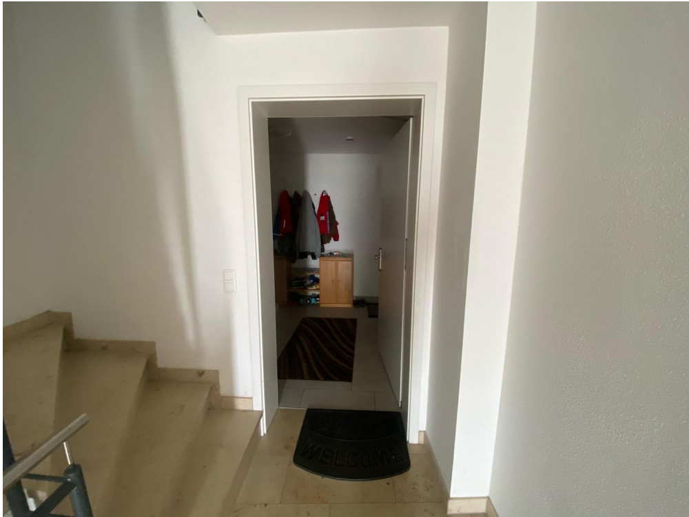
Eingang zur Wohnung