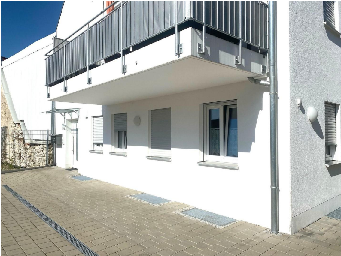
Wohnung von Süden