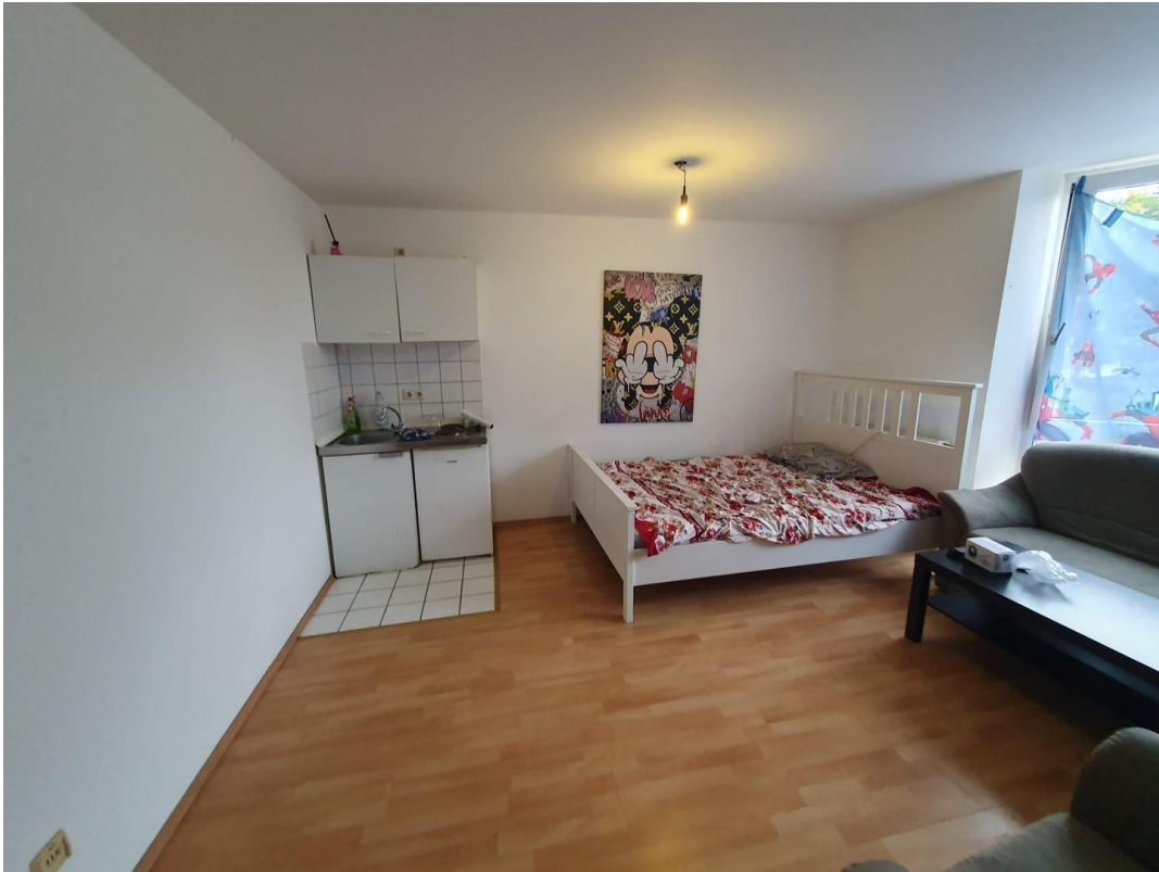
Wohnraum mit Küche