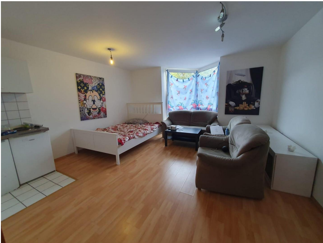
Wohnraum mit Küche