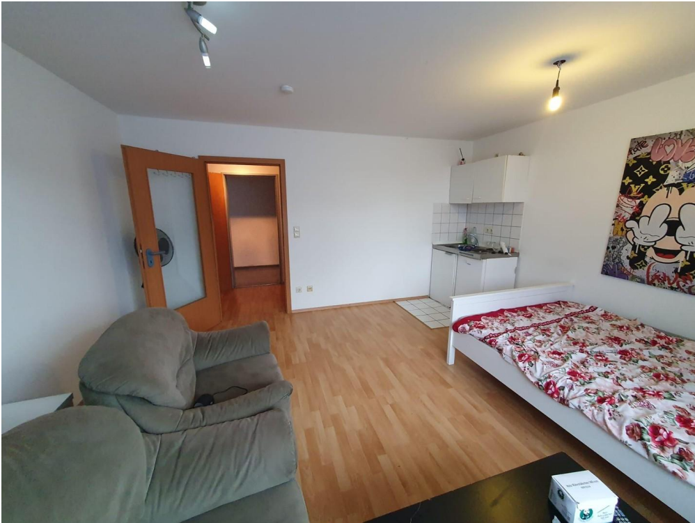
Wohnraum mit Küche