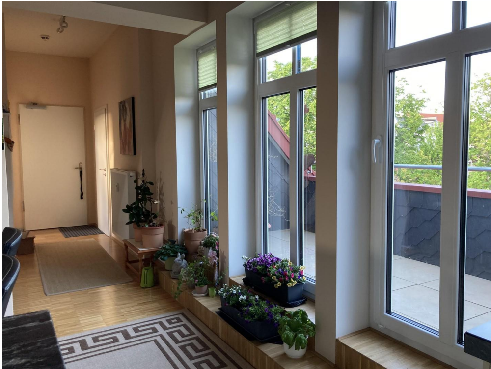
Blick Eingang Fahrstuhl