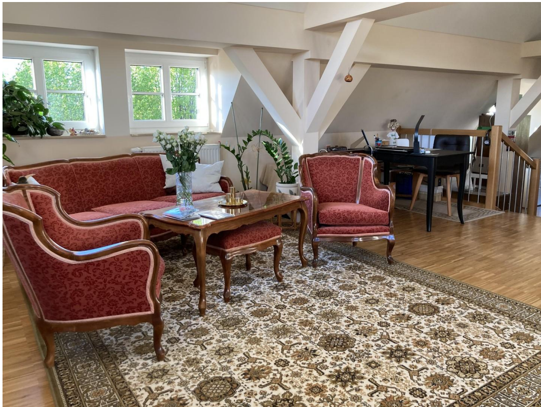
Wohnbereich oberer Teil