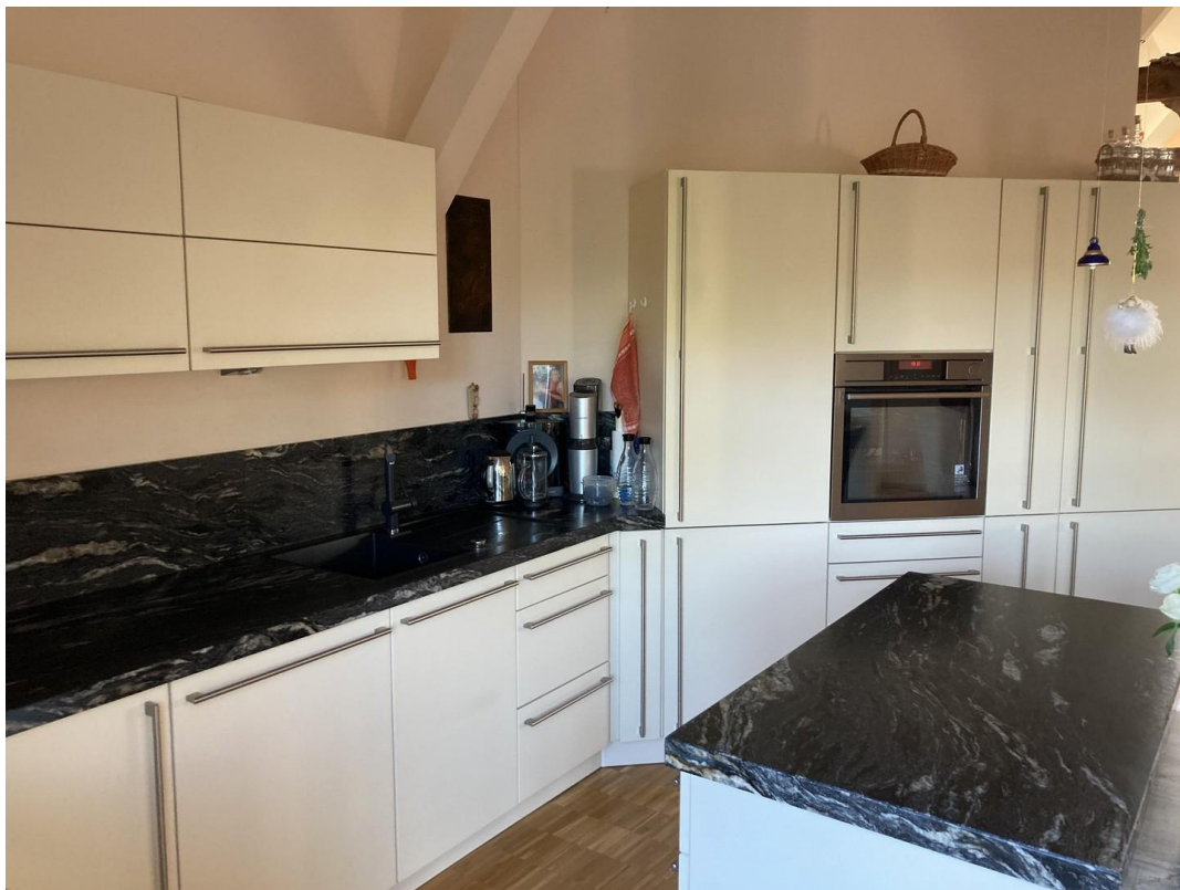
Einbauküche Richtung Spüle