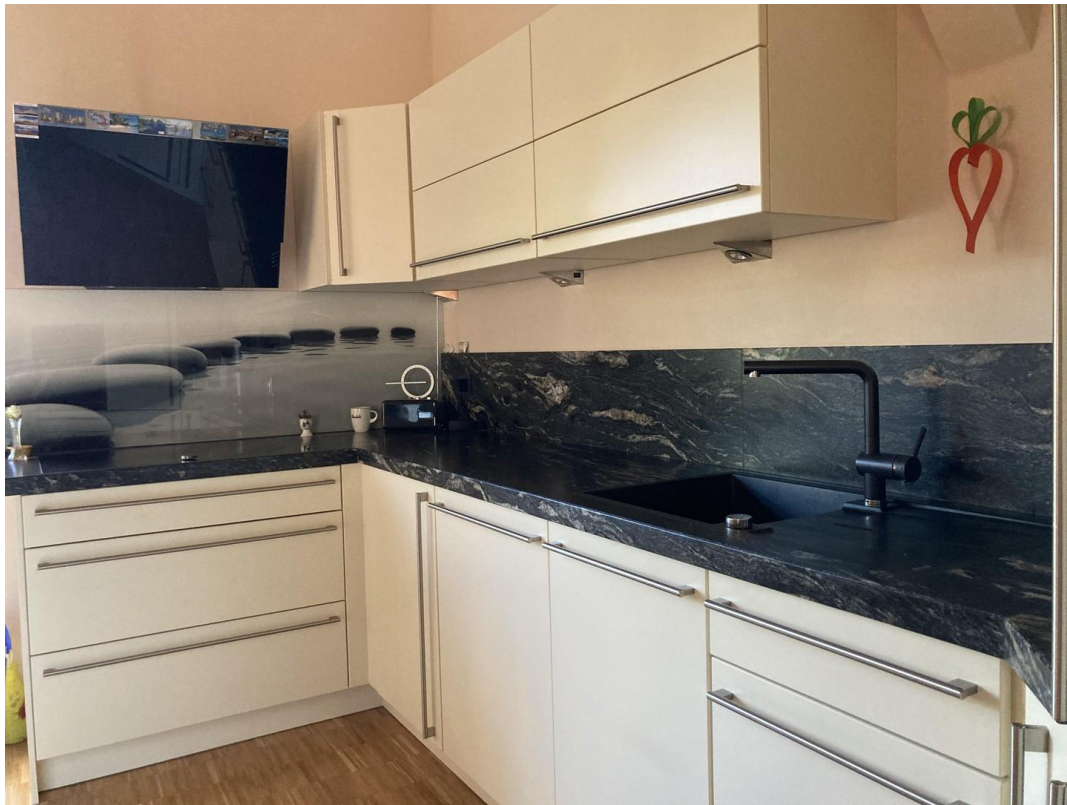
Einbauküche Richtung Kochstell