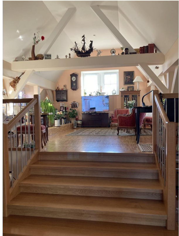
Wohnbereich oberer Teil