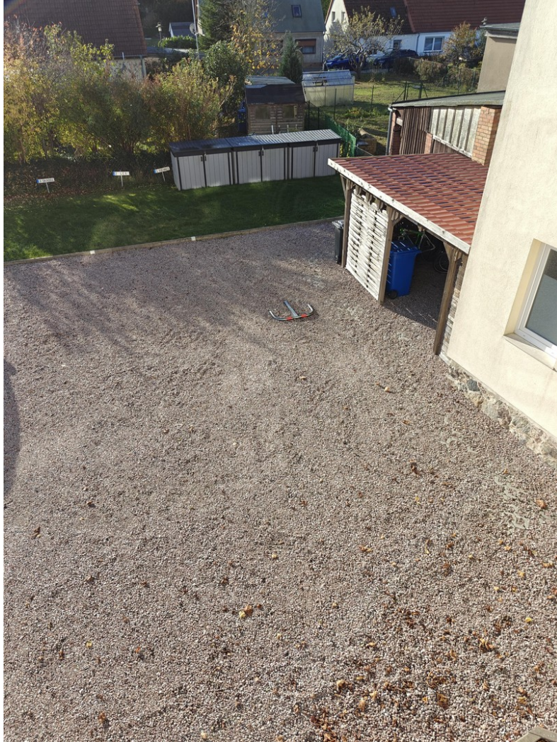
Hof mit Remise/Fahrradgarage