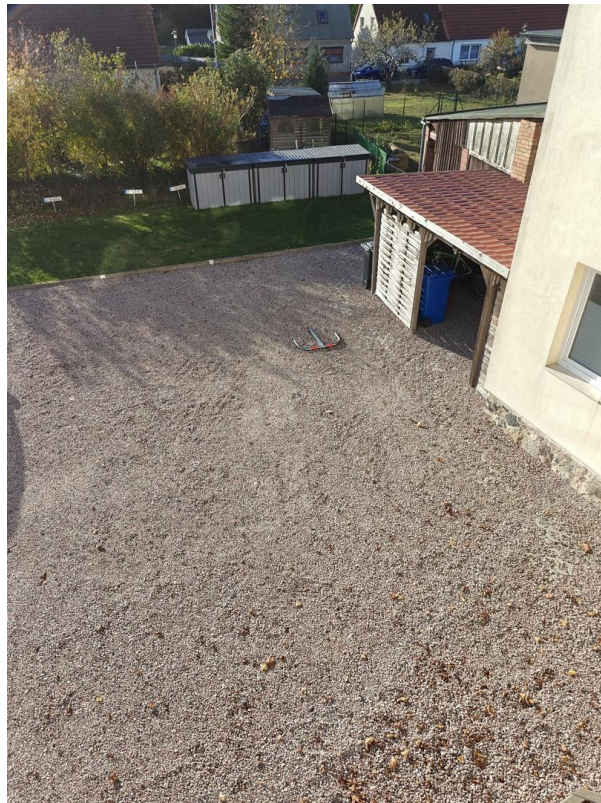
Hof mit Remise/Fahrradgarage