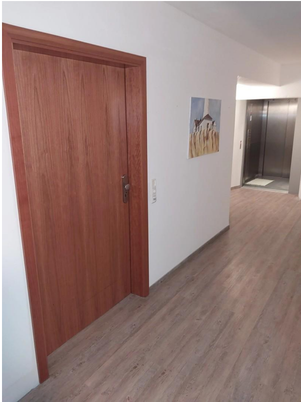
Flur mit Aufzug