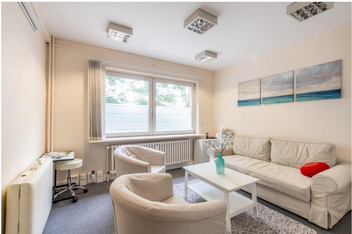
1. Büro- / Praxisraum