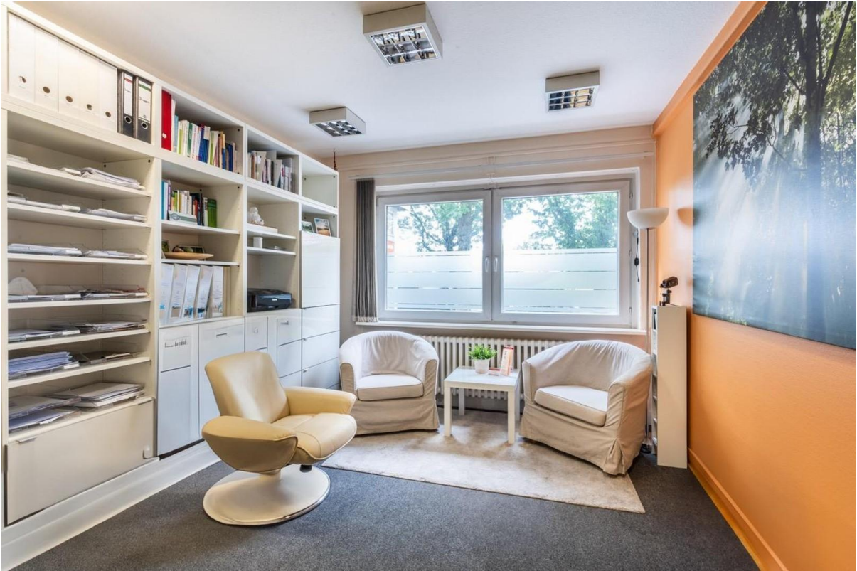
2. Büro- / Praxisraum