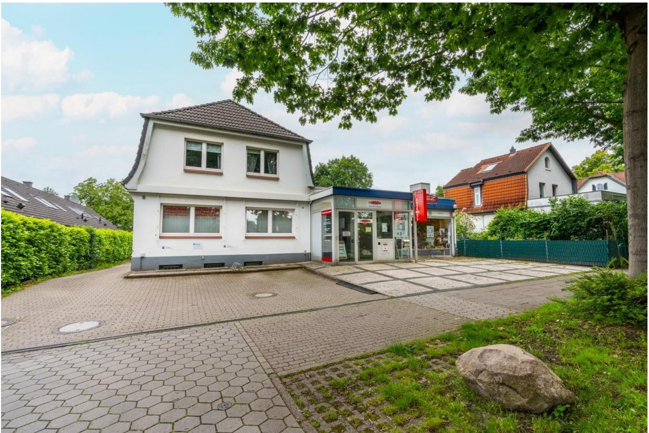
Parkplätze vor der Tür