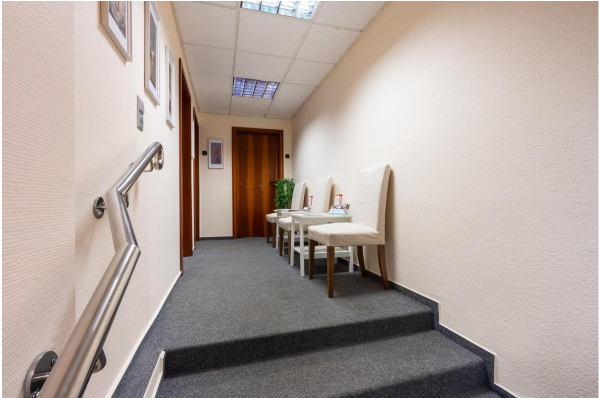
Flur mit Sitzbereich