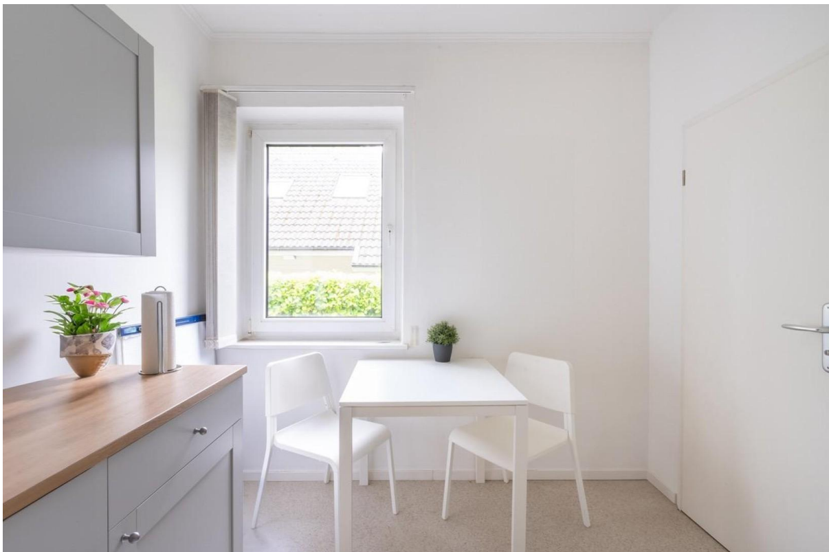
Küche mit Sitzecke