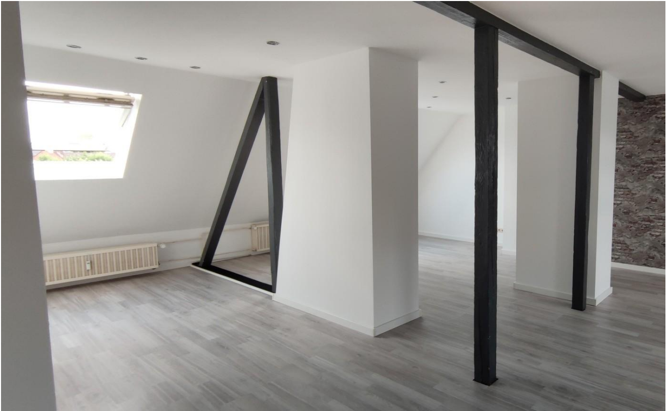
Wohn / Essbereich