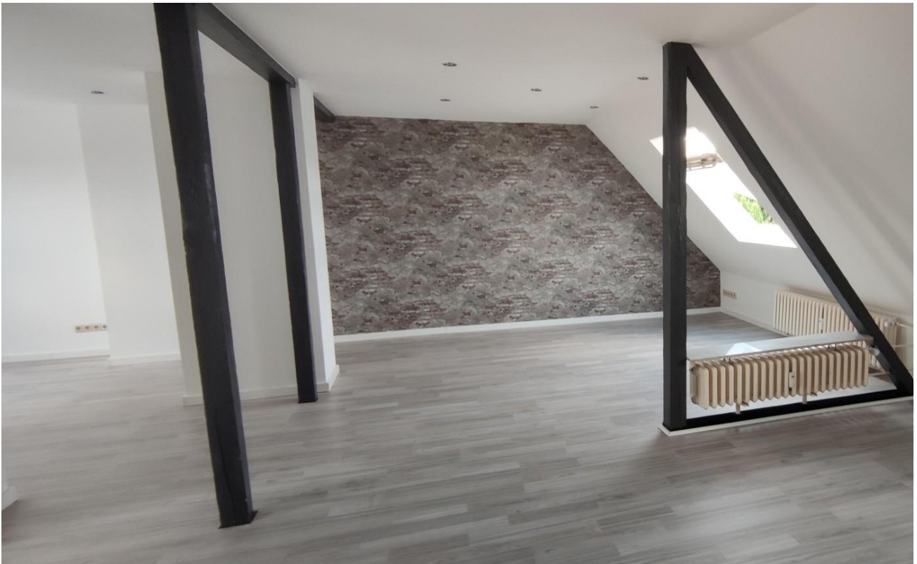
Wohn / Essbereich