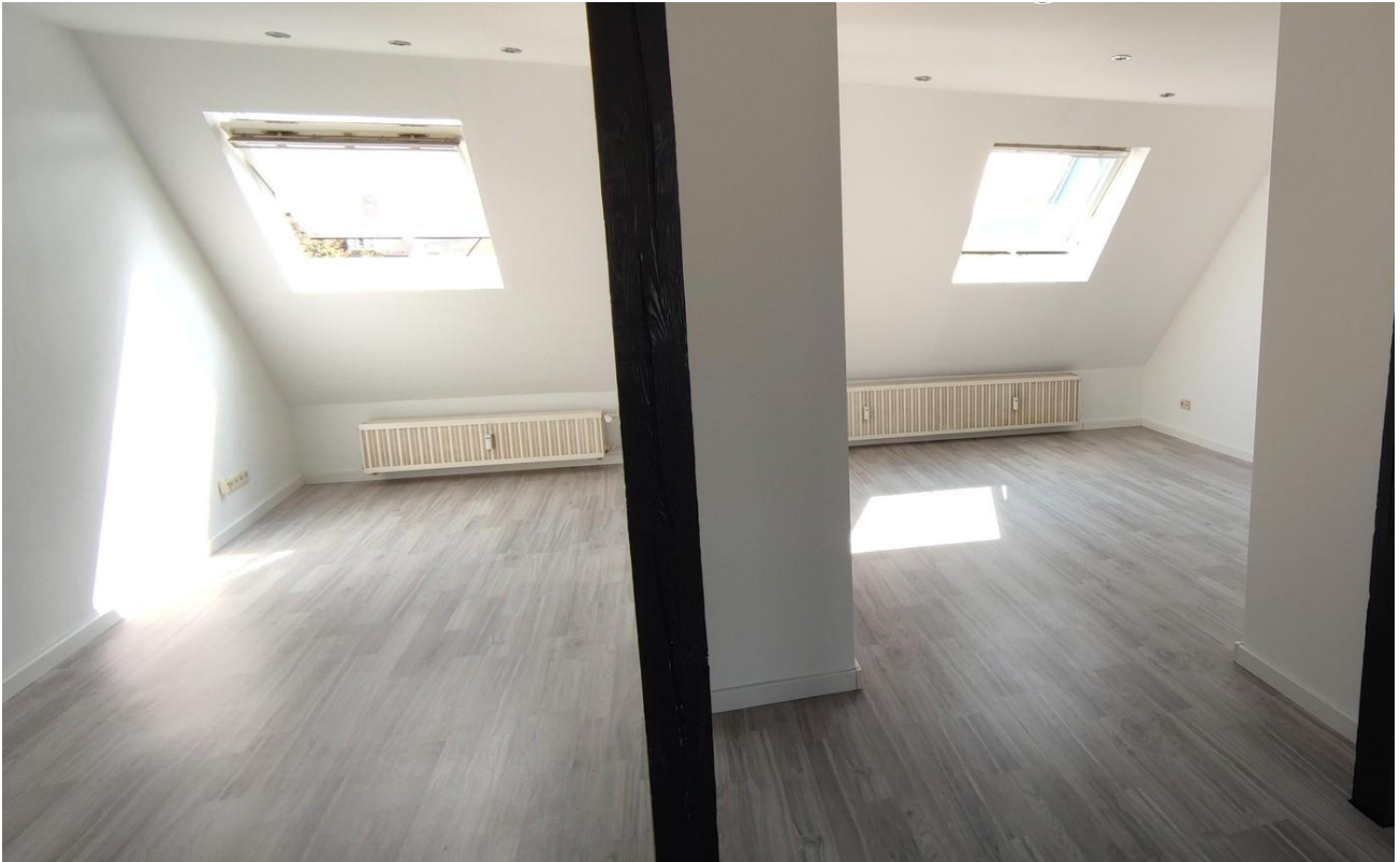
Wohn / Essbereich