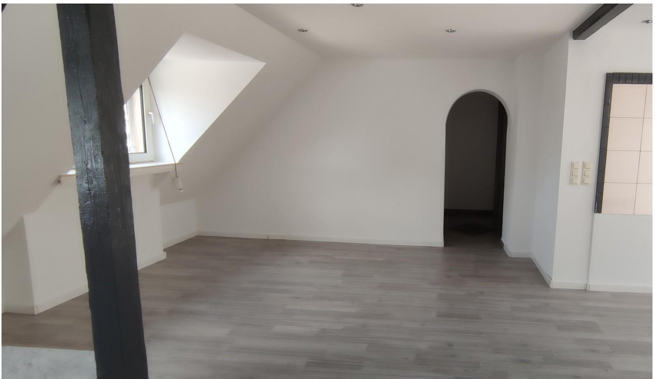
Wohn / Essbereich