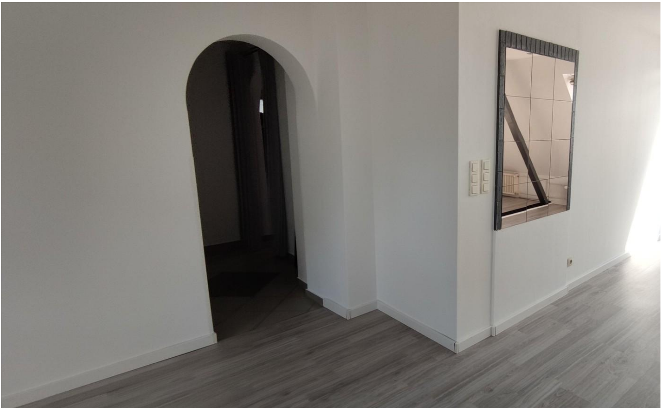
Wohn / Essbereich