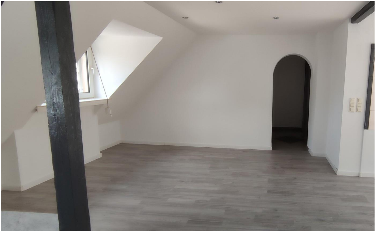
Wohn / Essbereich