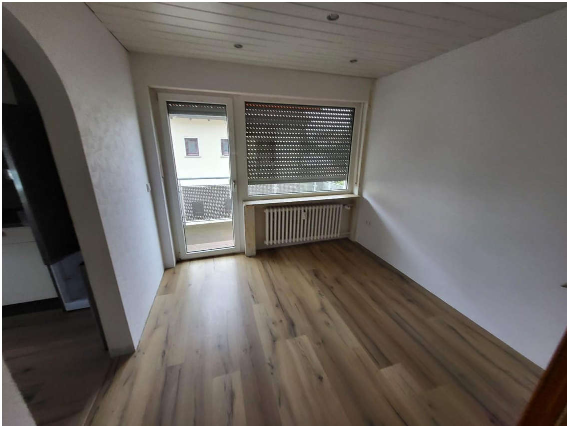
Esszimmer mit Balkon