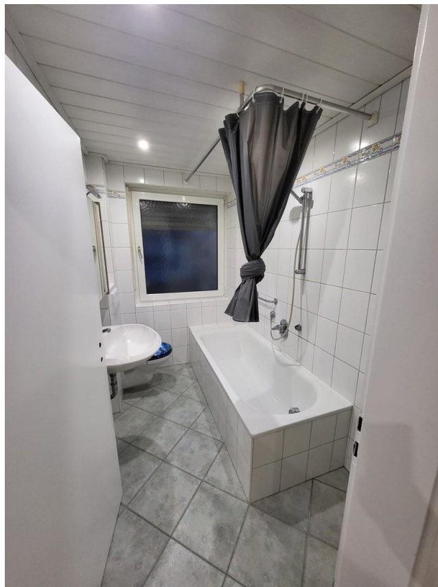
Tageslichtbad mit Badewanne