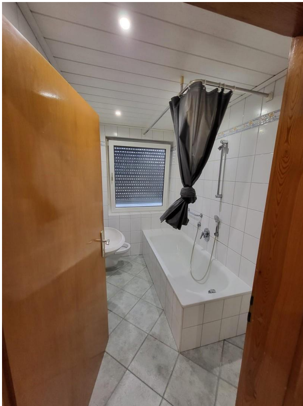
Tageslichtbad mit Badewanne