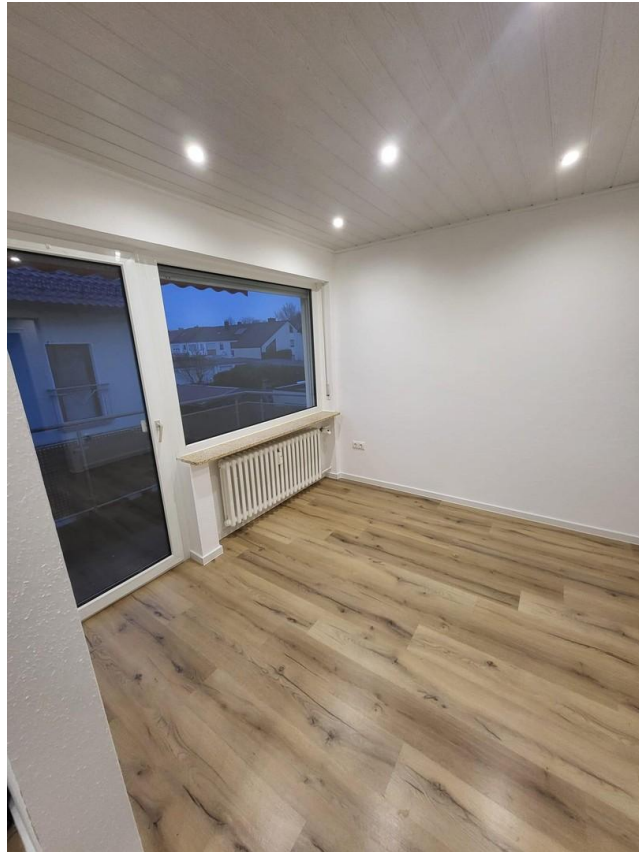
Esszimmer mit Balkon