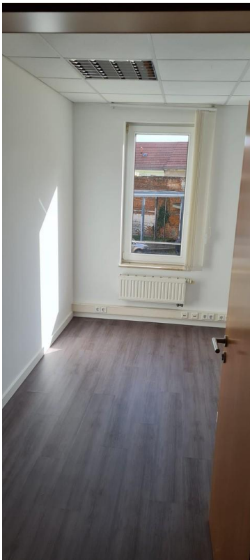
Kleiner Raum (9,20m 2 )