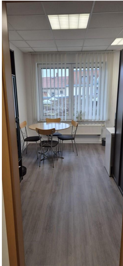
Weiterer opt. verfügbarer Raum