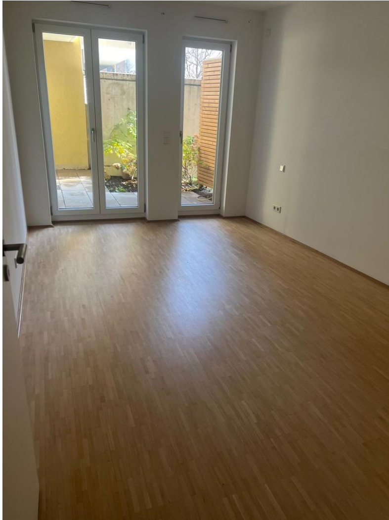
Schlafzimmer und Terrasse