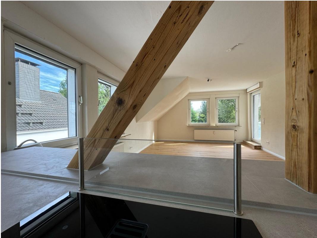
Blick aus offener Wohnküche