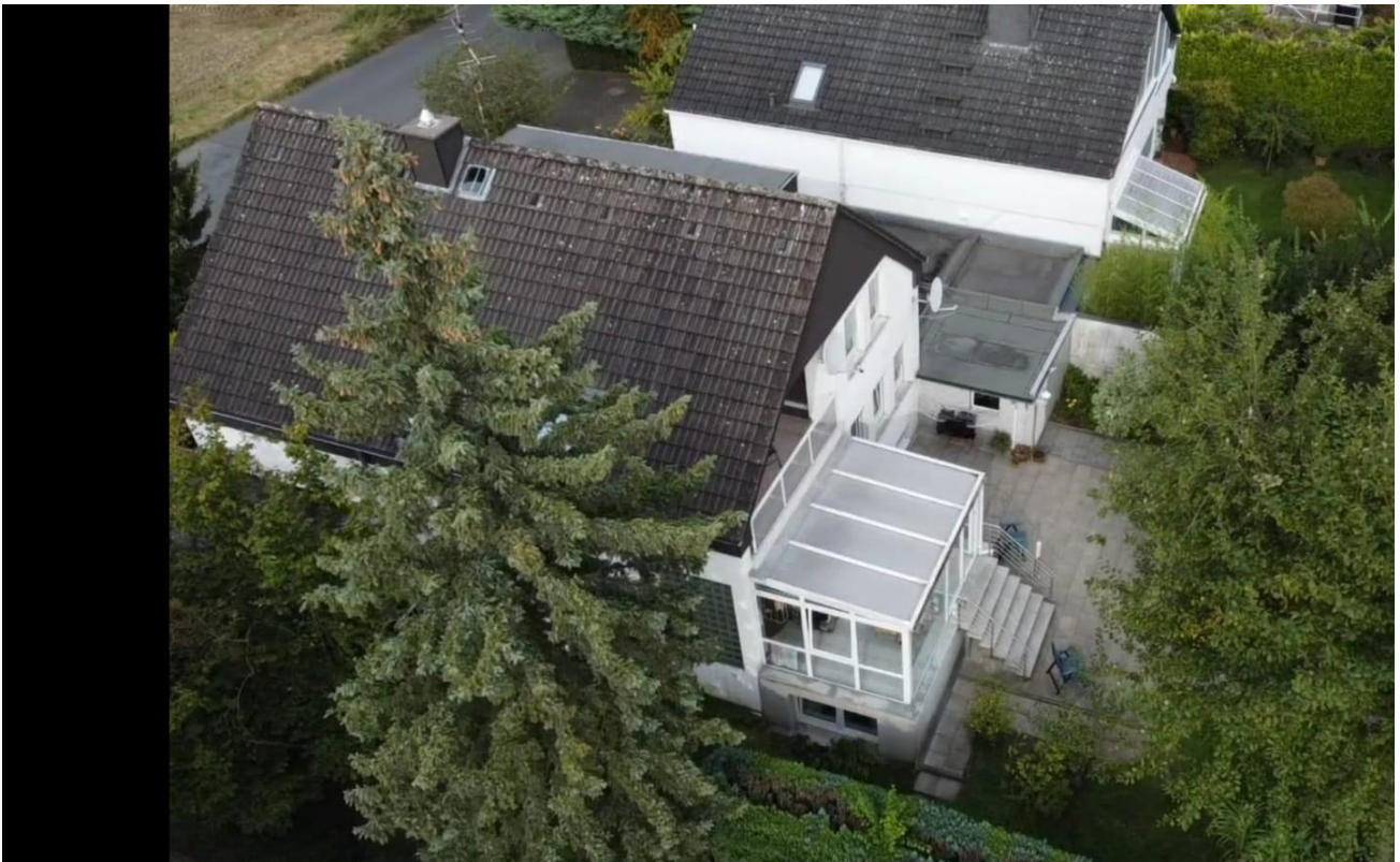
Rückansicht mit Balkonseite