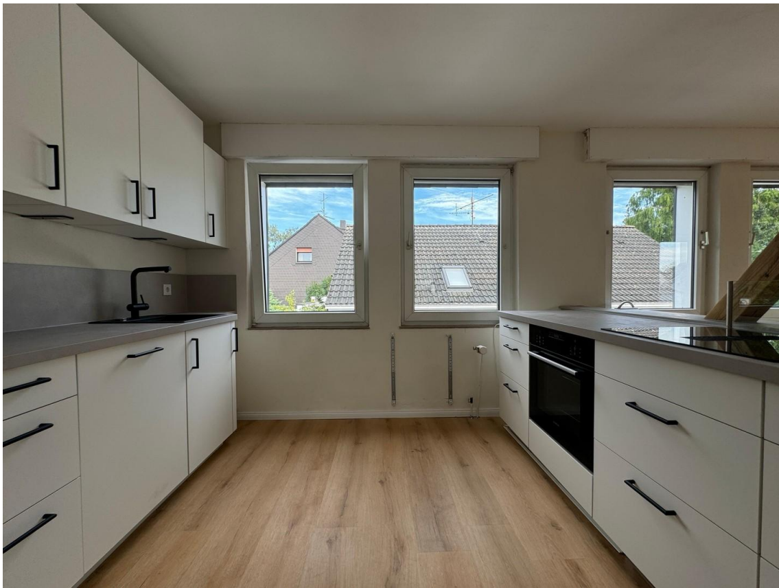
Blick in offene Wohnküche