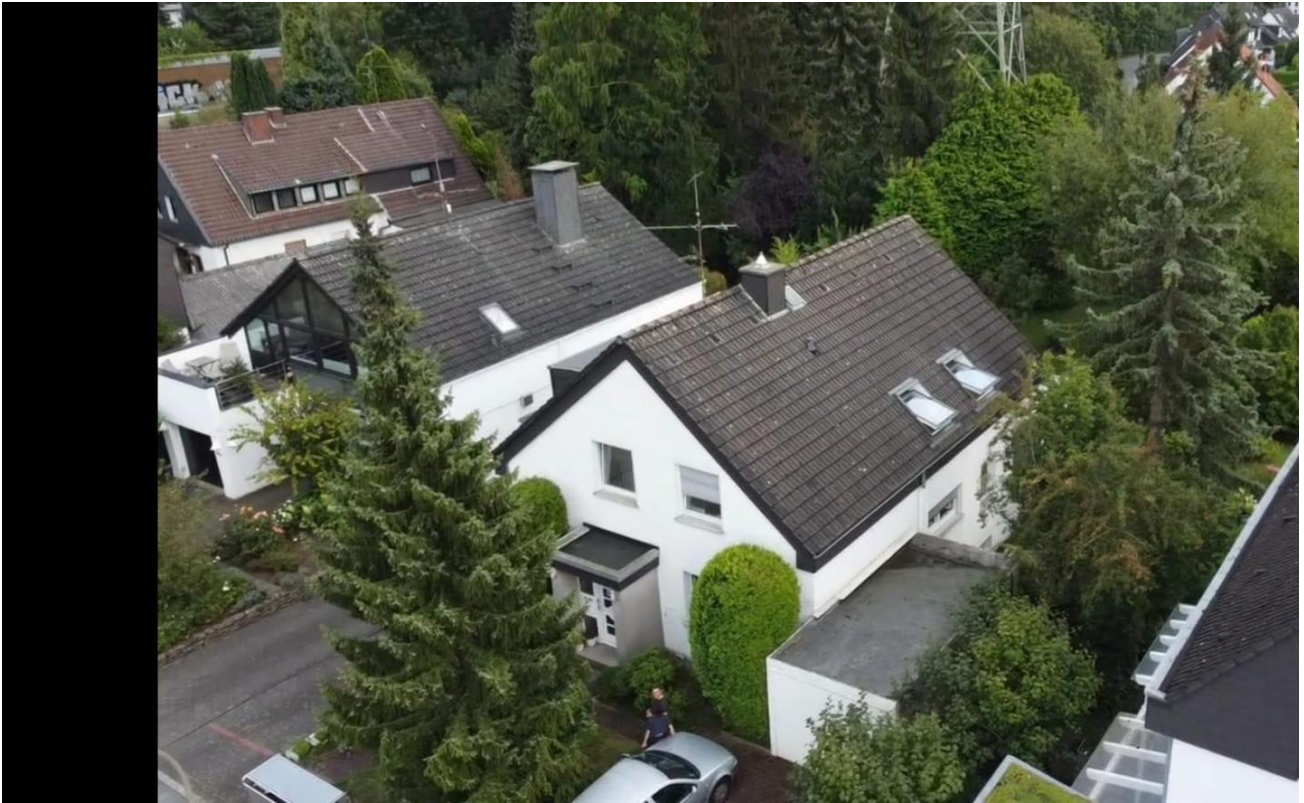
Frontansicht vom Haus