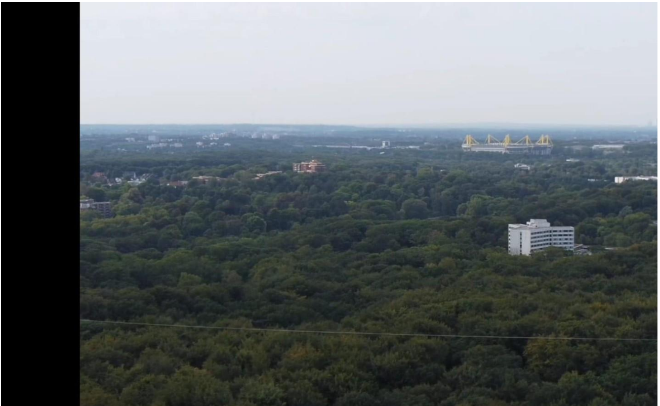
Stadion und Stadt nicht weit