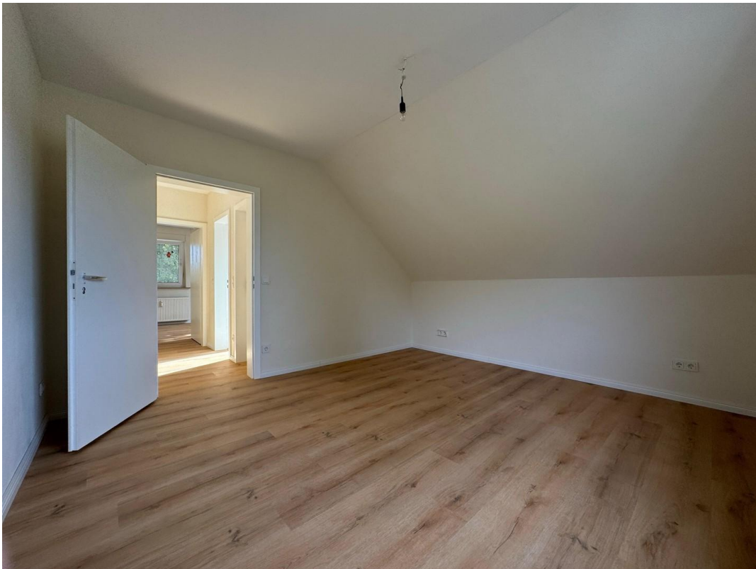
Schlafzimmer 2 Nordwestlage