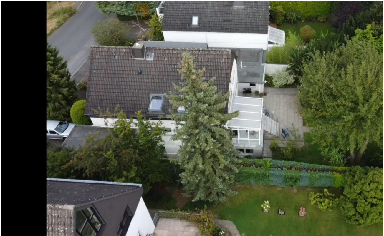
Seitenansicht mit Gartensicht