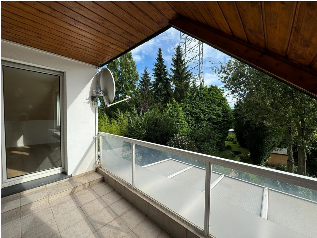
Südbalkon mit Blick ins Grüne