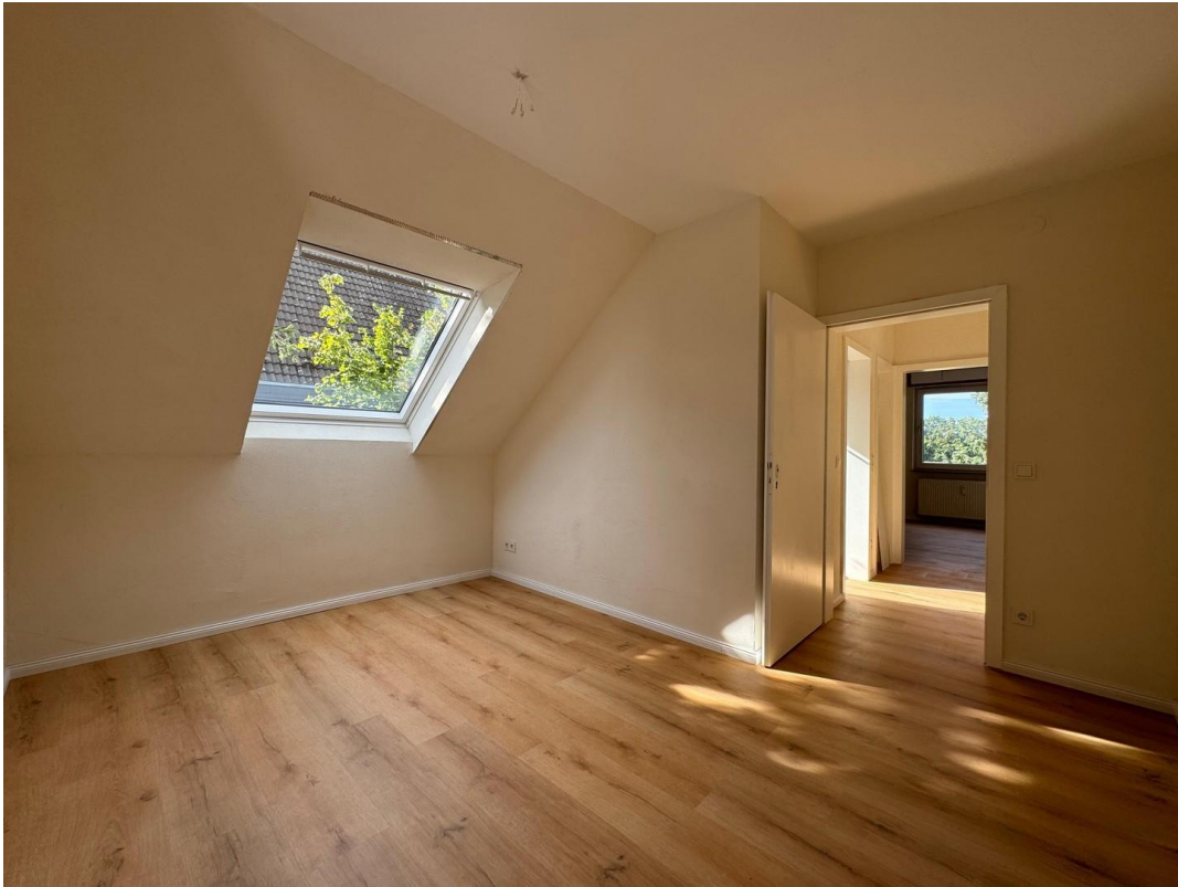
Schlafzimmer 1 Südwestlage