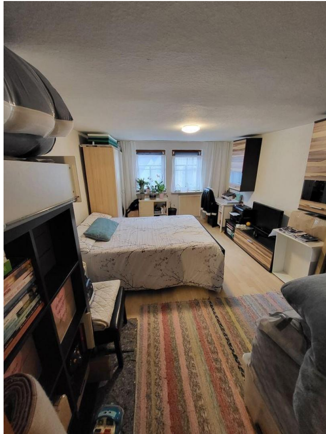
Raum ist Teilmöbliert