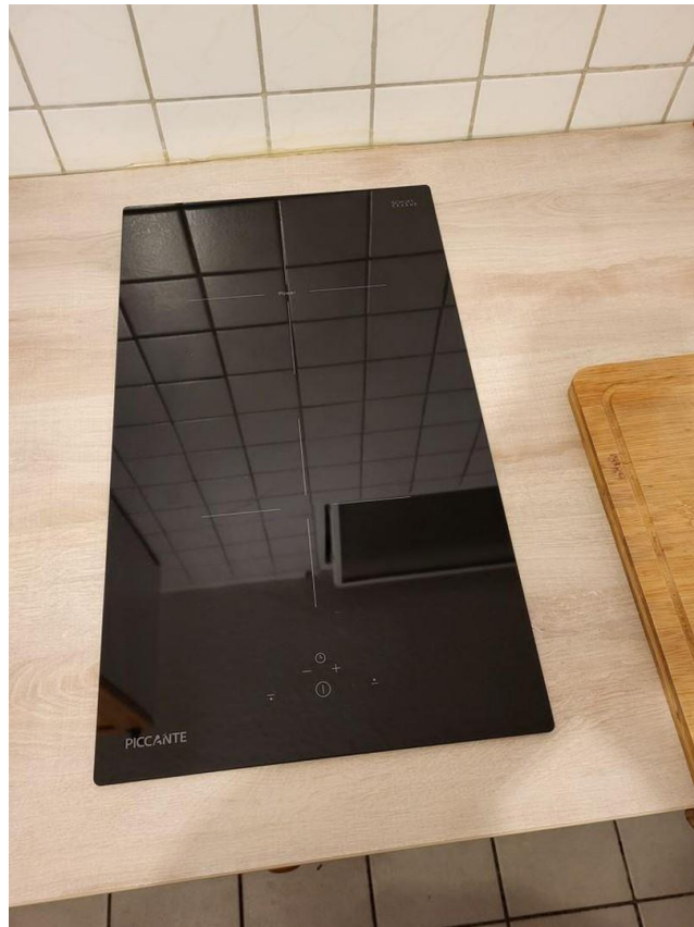
Herd kann übernommen werden