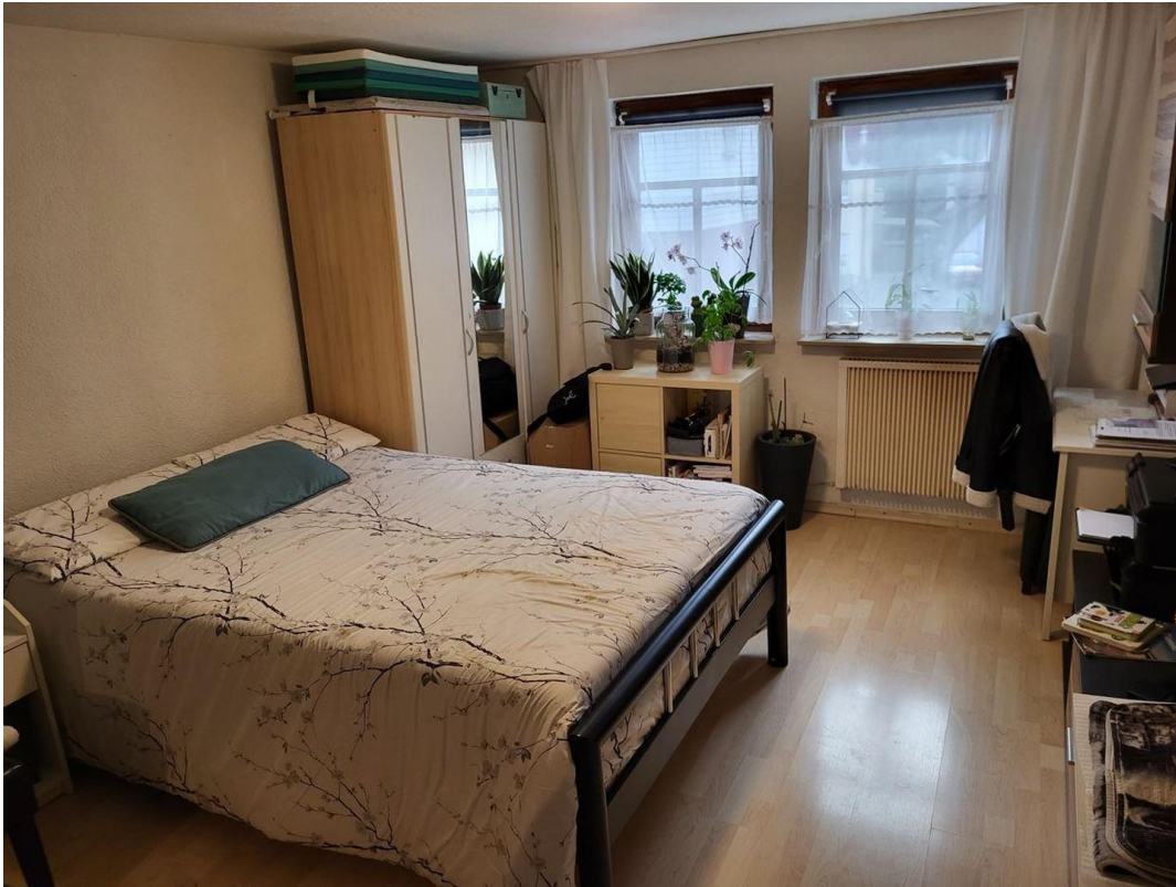
Schlaf- und Wohnzimmer