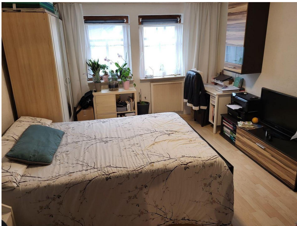
Raum ist Teilmöbliert