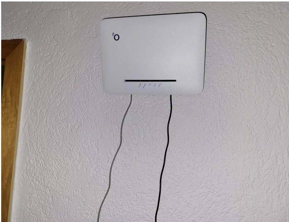
Schnelles Internet verfügbar