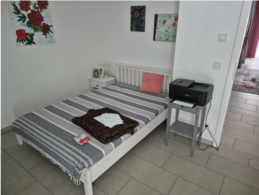
Kinder- / Arbeitszimmer