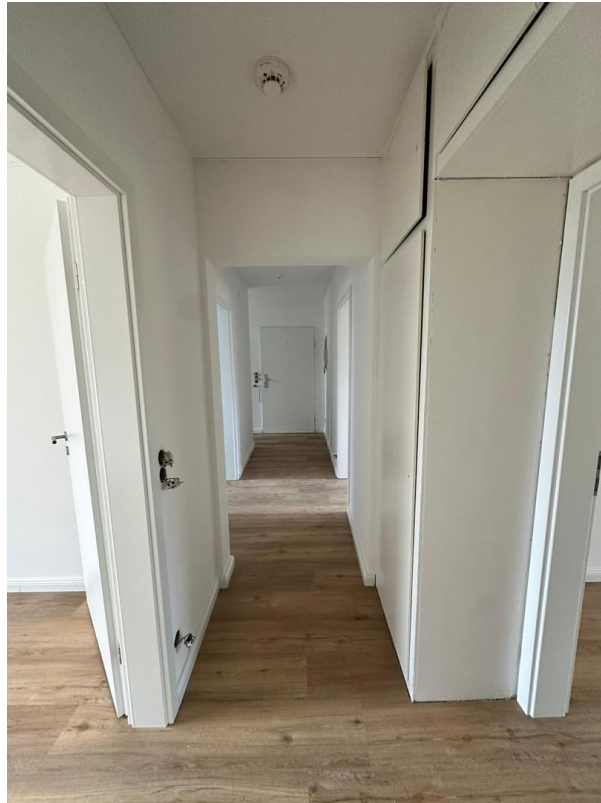
Flur mit Einbauschränken