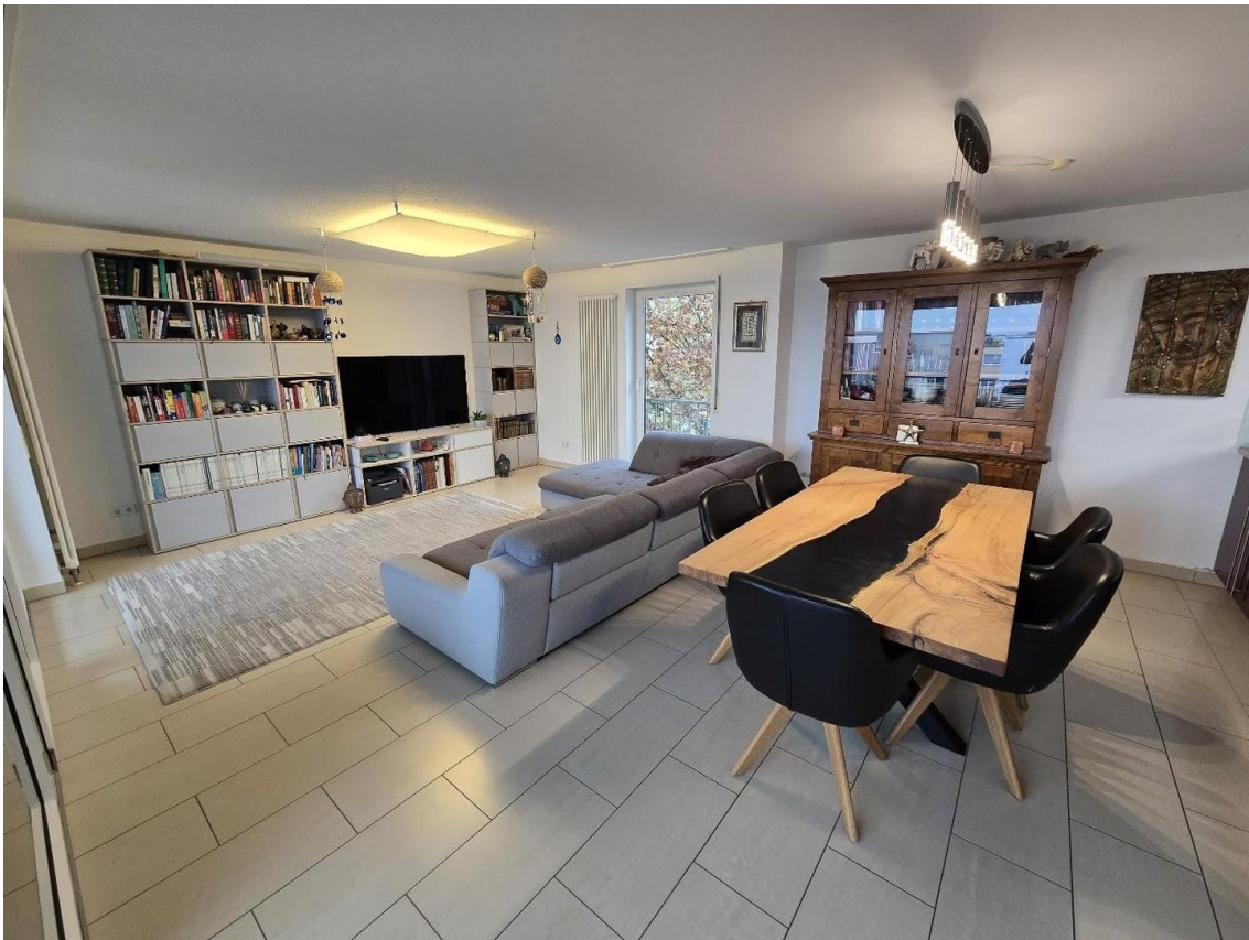
Wohnzimmer mit Essbereich