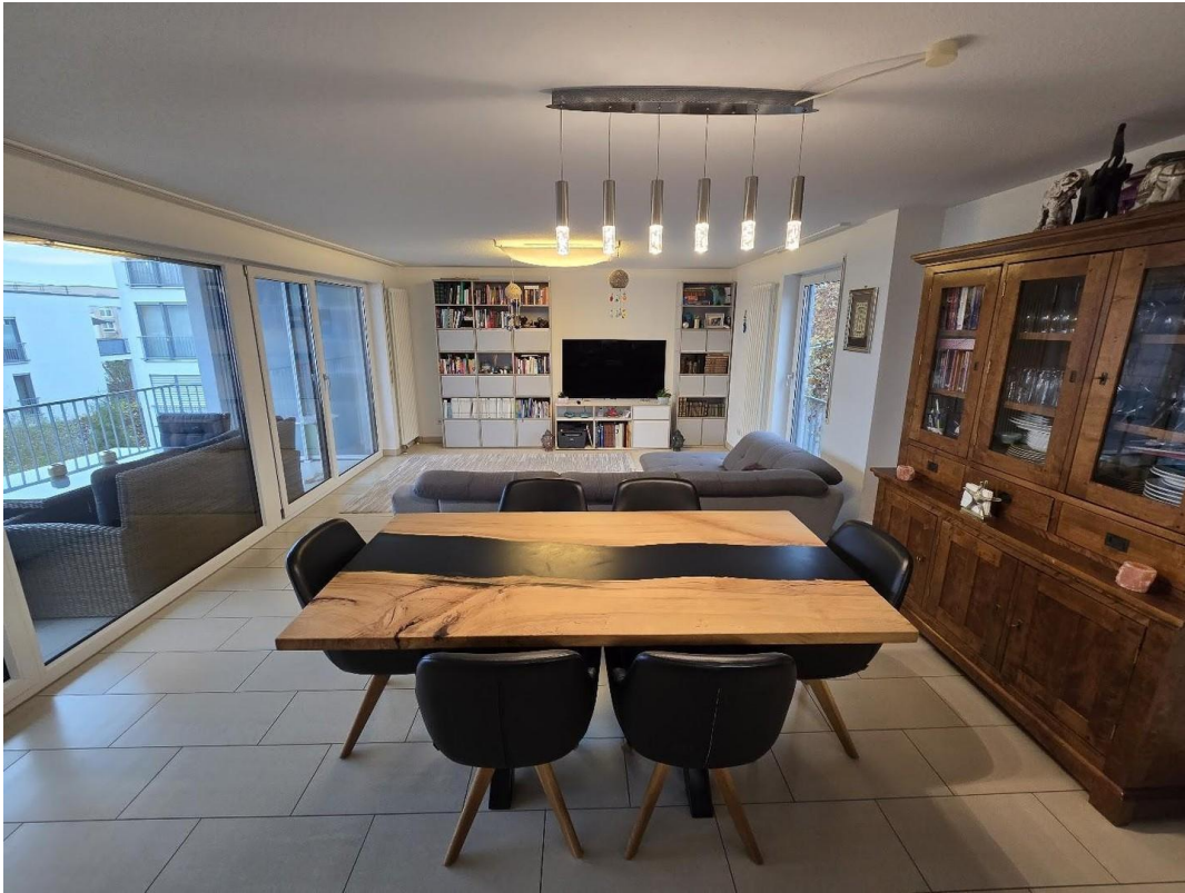
Wohnzimmer mit Essbereich