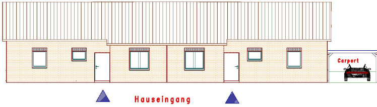
▲ Hauseingang ▲ Haus-Nr. 2 C Nord-Ansicht Haus-Nr. 2 D