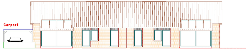
Haus-Nr. 2 D Süd-Ansicht Haus-Nr. 2 C