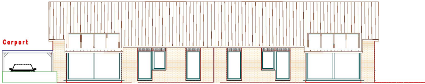
Haus-Nr. 2 D Süd-Ansicht Haus-Nr. 2 C