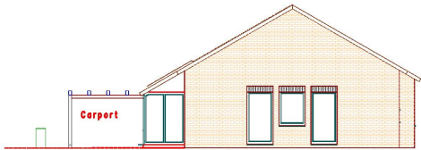
Ostansicht - Haus-Nr. 2 C vom Tjabberantsweg