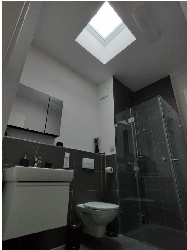
Bad mit Oberlichtfenster