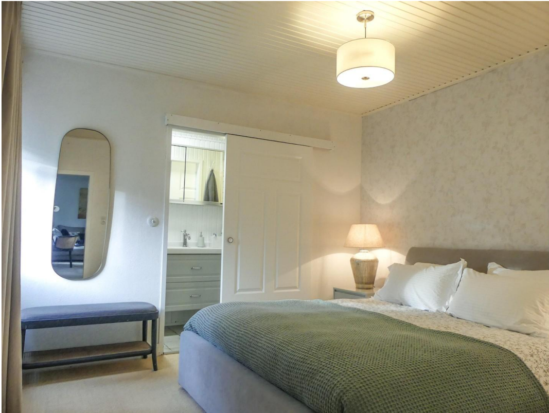
Schlafzimmer 1 mit Bad