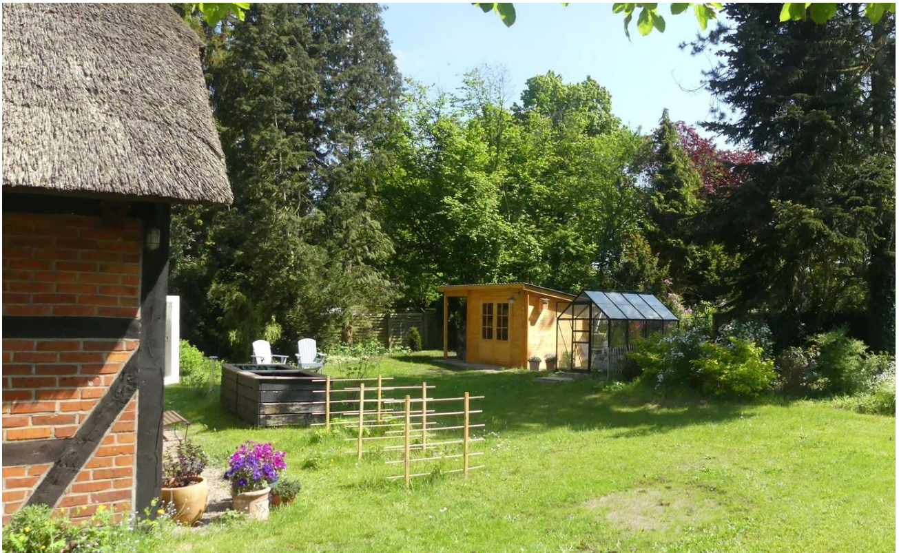
Garten mit Gewächshaus