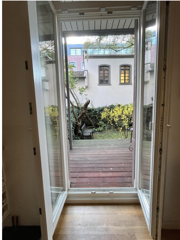
Blick auf die Terrasse